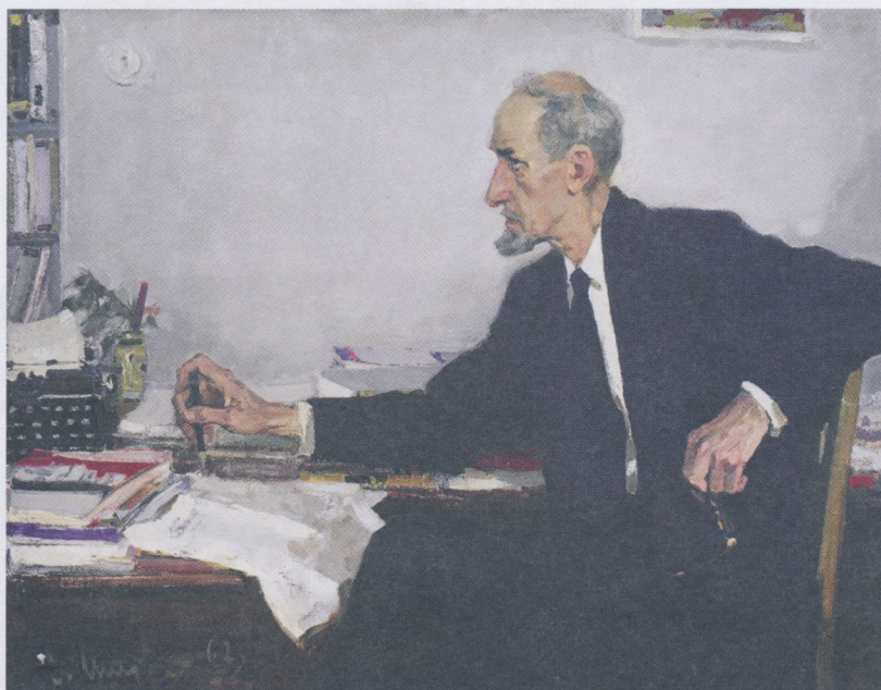
ТЕКСТ: ТАТЬЯНА СЕМИЛЕЙСКАЯ (ПЕРМСКАЯ ИНТЕРНЕТ-ГАЗЕТА «ТЕКСТ»)

По воспоминаниям его современников, он был нетерпелив к несправедливости и мог убедительно доказать неправоту оппонента. Особенно это проявилось в ходе острейшей дискуссии по поводу даты основания Перми. Через настойчивые письма, выступления в печати и дискуссии с историками он смог добиться признания официальной даты возникновения Перми в 1723 году. Значит, именно благодаря ему Пермь в этом году будет праздновать свое 300-летие.