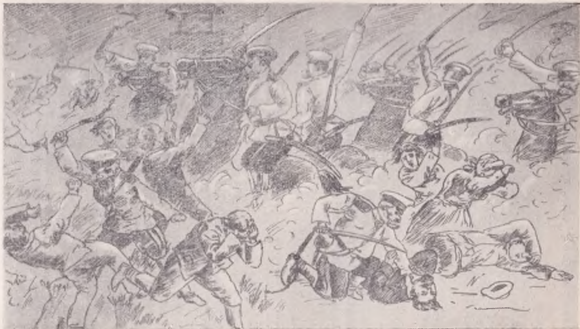
Избиение казаками рабочих на Вышке 10 июля 1905 г. — гектографический рисунок на обороте отпечатанной в типографии листовки Пермского комитета РСДРП (см. док. № 83).