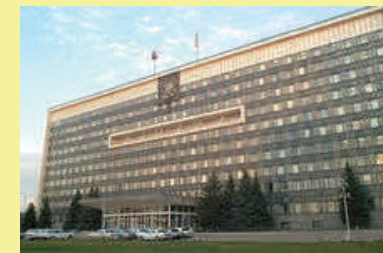
Законодательное Собрание Пермского края