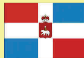
Флаг Пермского края