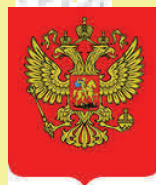
Герб Российской Федерации

Слово «федерация» означает «союз», «объединение». Российская Федерация — объединение республик, краев и областей. Герб и флаг страны, Конституция, высшие органы власти — вот то, что их объединяет.