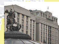
Государственная Дума Российской Федерации