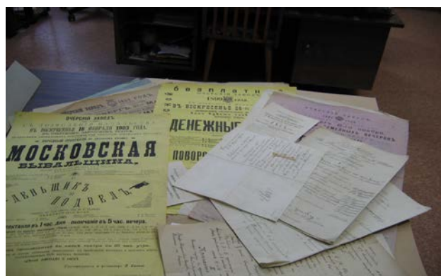
Афиши конца XIX- начала XX века

Названия некоторых спектаклей несколько непривычны для современного слуха: «Жареный гвоздь», «Святки», «Домовой»,