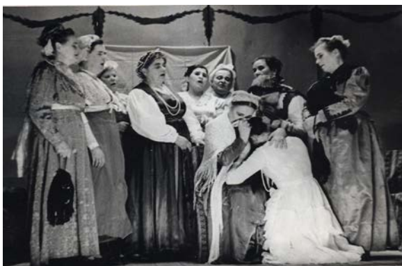
Сцена из спектакля «Бедность – не порок», 1967 г.

Бояршинов Е. Таланты и хранители // Очерский край. – 2002. – 10 декабря.