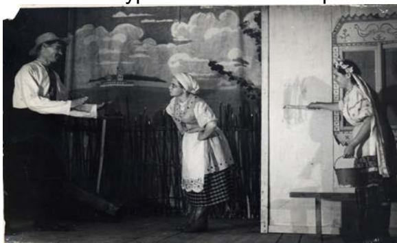
Сцена из спектакля «Свадьба в Малиновке», 1959 г.