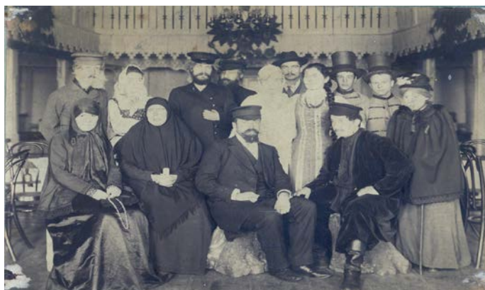
Актеры Очерского театра, 1904 г.