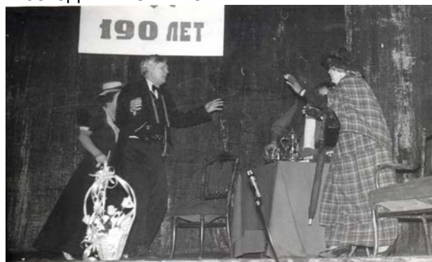
Сцена из спектакля «Юбилей» А.П. Чехова

В этом единстве театра и режиссера ведущую роль играет режиссер. Каждая нота спектакля, каждый эпизод, каждая мизансцена убедительно говорят о том, что режиссер знает, чего хочет, и знает, как это осуществить с помощью актерской игры во времени и пространстве. Если, глядя на обстановку заштатного банка в «Юбилее», мы понимаем, что режиссер с первых секунд спектакля заявляет — никакого «осовременивания» пьесы не будет, перед вами (зрителями) предстанут типы людей столетней давности, то это свое заявление он упорно и последовательно подтверждает, добиваясь от актеров поиска таких отношений к жизни и друг другу, которые позволили бы им перевоплотиться в людей другой эпохи.