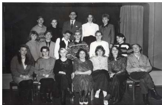
Труппа театра, 1993 г.