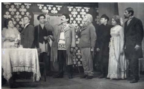
Сцена из спектакля «Лес», 1973 г.

Идею пьесы нашим самодеятельным артистам удалось донести до зрителя яркой, впечатляющей игрой, правдивостью созданных ими образов.