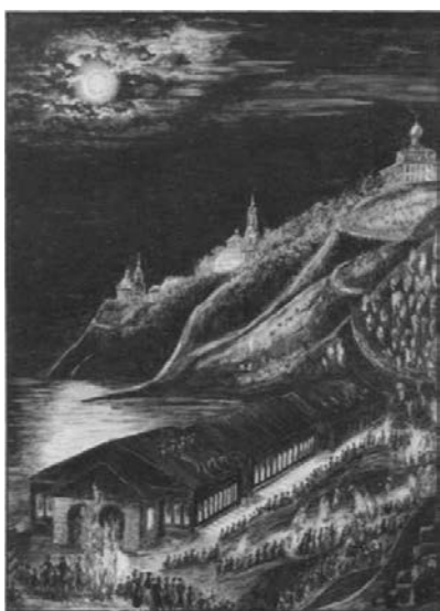
Опера в соляном амбаре. Акварель Ю. Силина

В 1807 году Строгановы разрешили своим «вольноотпущенникам» организовать постоянный театр в Очерском заводе. Вскоре новый театр привез в Пермь свои спектакли и показал их в строгановских амбарах на берегу Камы. Театральную группу пополнили хор и оркестр другого уральского магната Всеволожского.