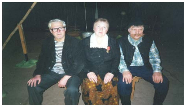
Сцена из спектакля «Вечер», 2006 г.