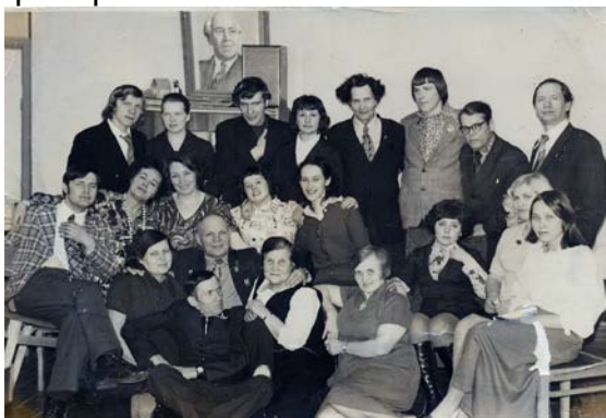
Труппа театра, 1976 г.