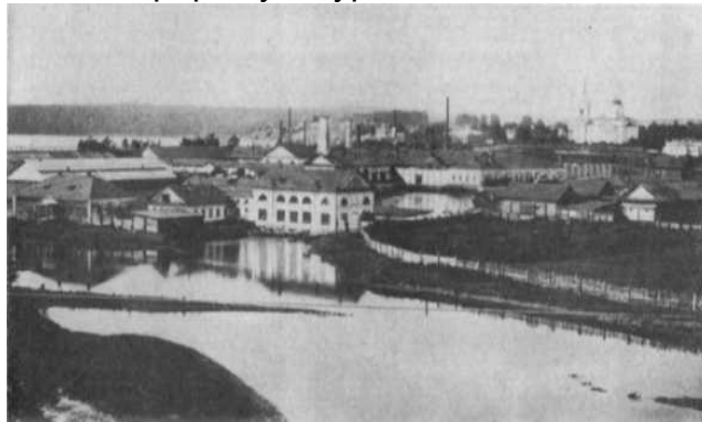
Очерский завод. Начало XX века

Специфической особенностью Прикамья, да и всего Урала этой поры, было наличие здесь развитой горнозаводской промышленности, основанной на подневольном труде и монополии латифундистов, бывших одновременно и заводчиками, и помещиками. Каждое горнозаводское предприятие имело свой отдельный заводской поселок — своеобразное поселение городского