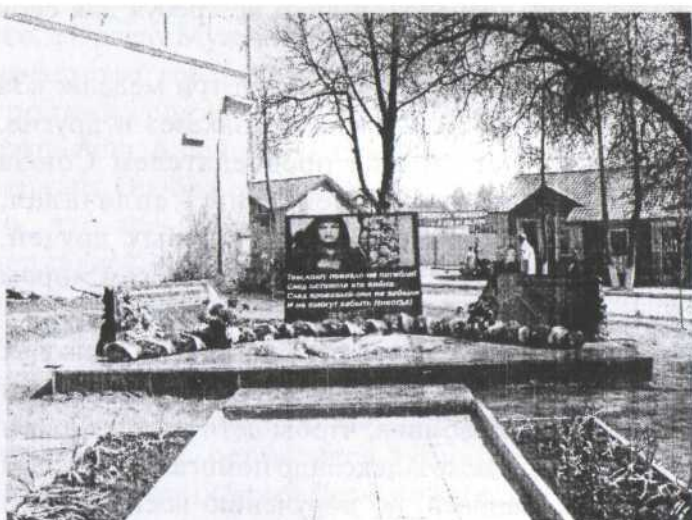
Памятник «Боевое братство» погибшим воинам локальных конфликтов.