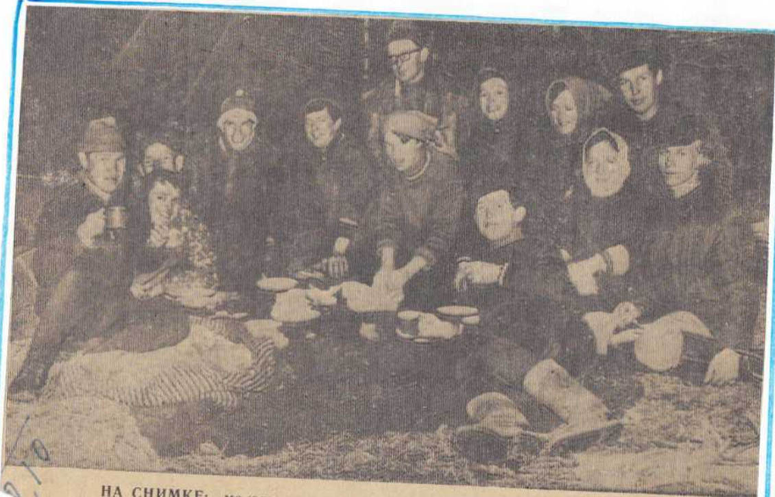
НА СНИМКЕ: молодые туристы из Очеры.