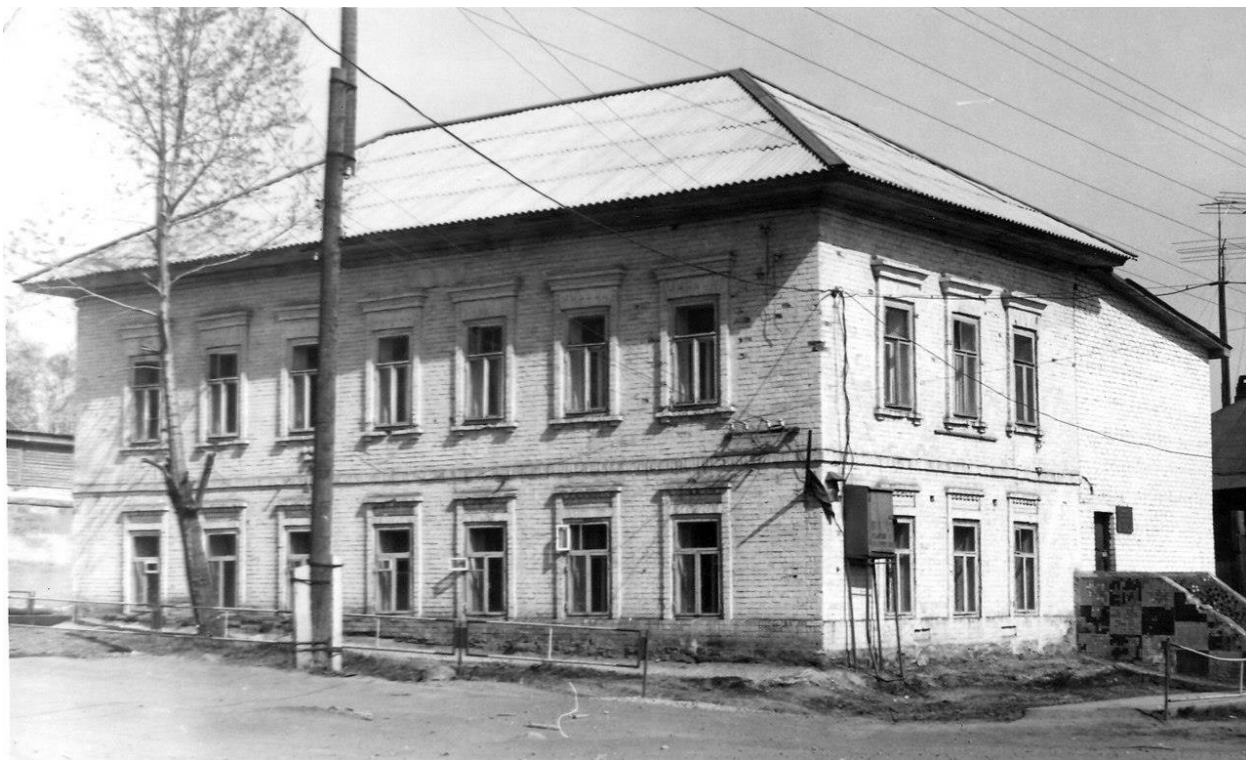
Здание начальной женской школы, постройка 1848 года