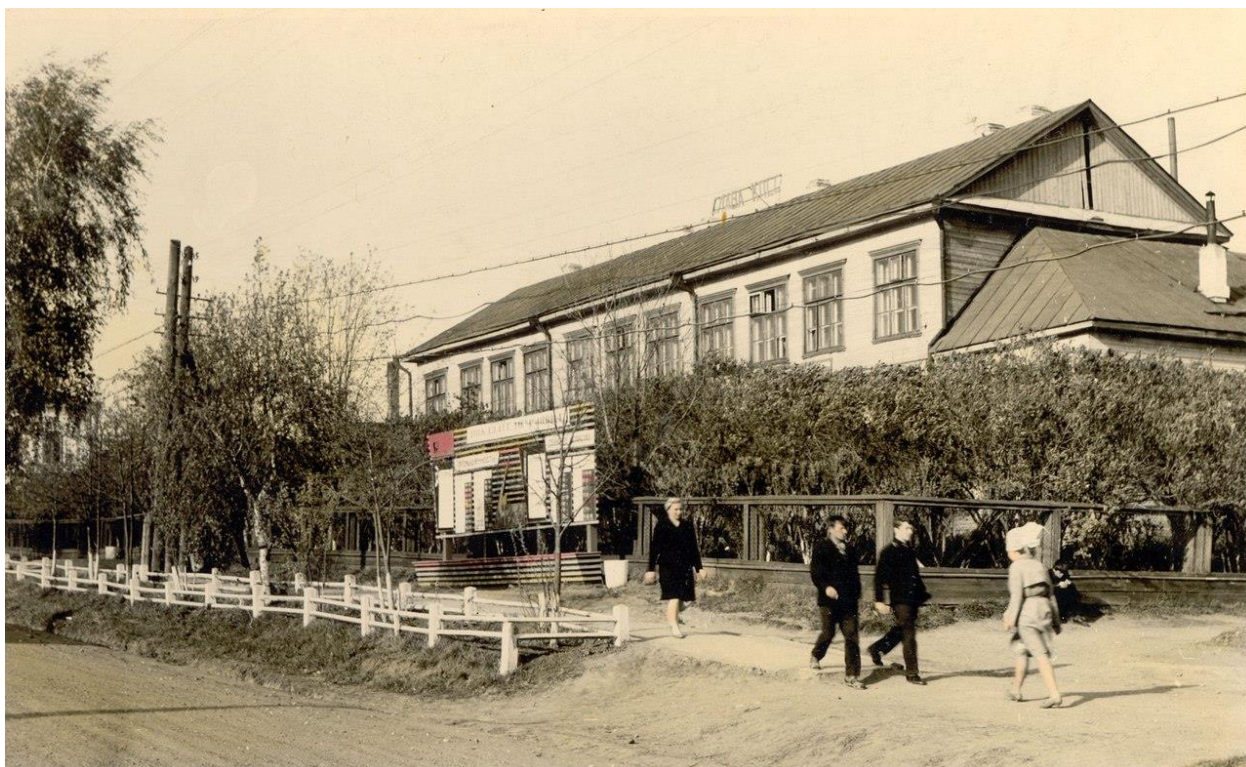
Восьмилетняя школа (корпус с 4 по 8 класс)