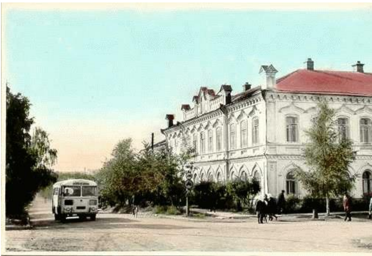
Здание бывшего Верх-Очёрского волостного правления (Школа № 1)