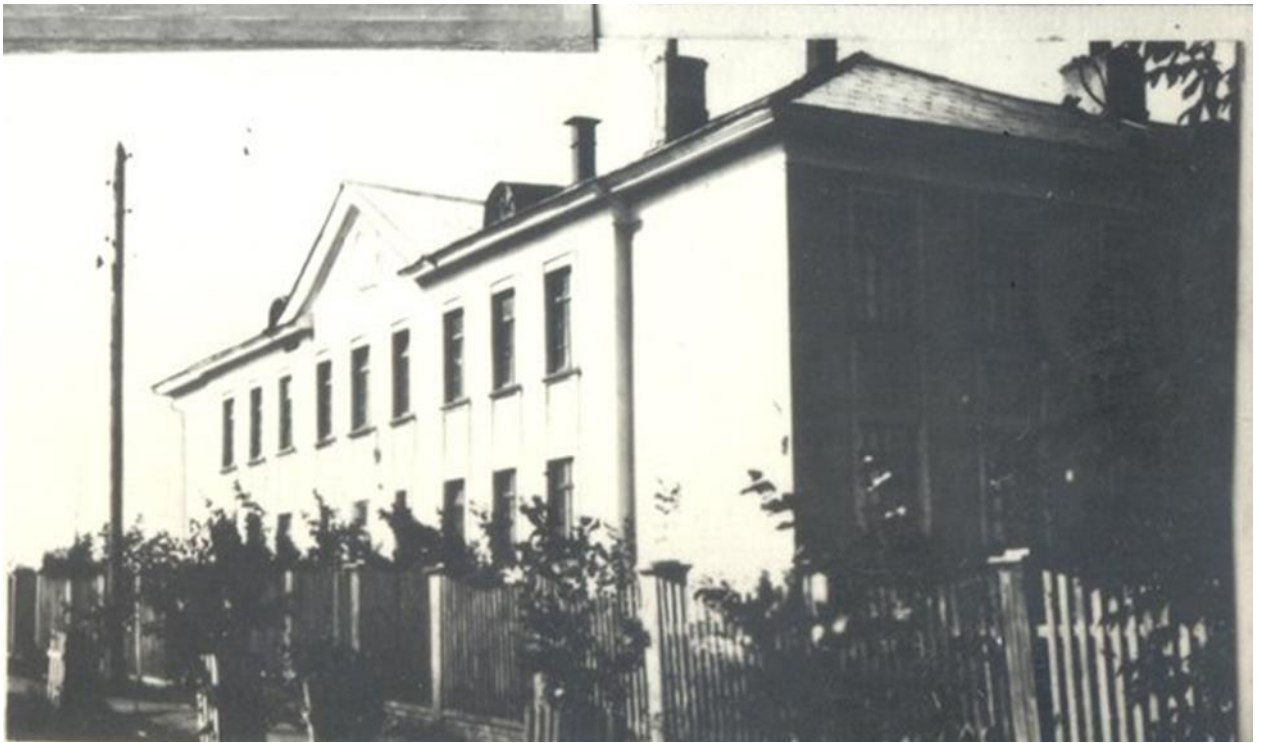
Заречная школа (ОСОШ № 2)

В 1949 г. в СССР было введено всеобщее обязательное семилетнее образование, а в июле 1950 посёлок Очёр стал городом . Полных средних школ в районе не хватало – выросла ребятня из начальных классов, а в городе только «семилетка» и «первая средняя». «Семилетка» располагалась в самом центре, была удобна для посещения детьми из разных микрорайонов. Она со временем превратилась в «восьмилетку», пока не ушла под снос по причине ветхости.