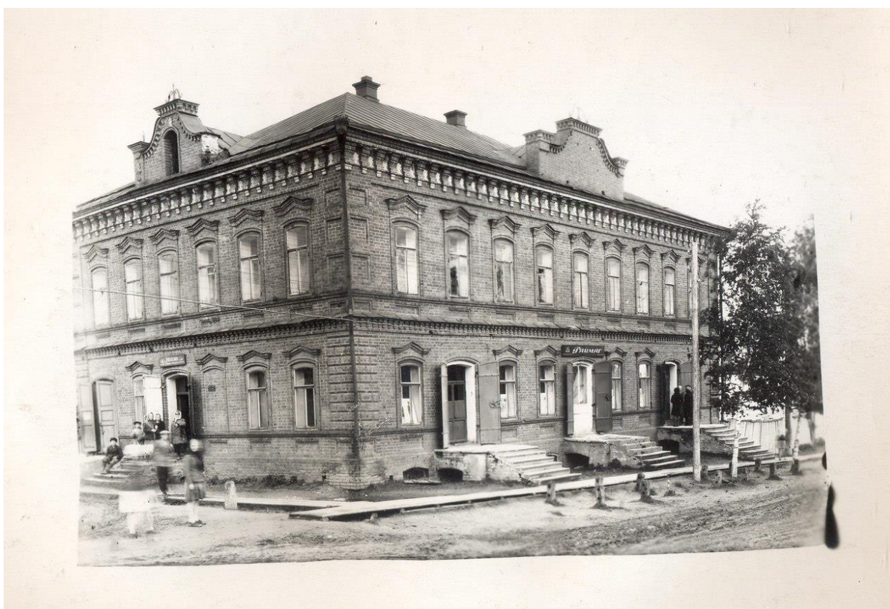
В этом здании располагались начальные классы "восьмилетки"