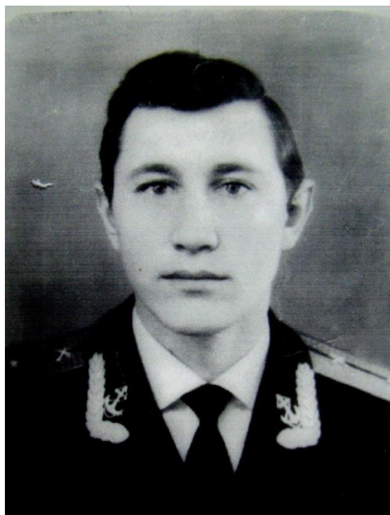
Александр Сергеевич Чудинов

Вместе с ним погибли еще 52 члена экипажа: 30 человек – от пожара и угарного газа, 22 утонули вместе с лодкой. 15 ноября 2018 года на берегу Очерского пруда, у бывшего пирса установлен обелиск в виде якоря с памятной табличкой: «Здесь находится именная капсула с морской водой с места гибели инженера АПЛ «К-8» капитан-лейтенанта Чудинова Александра Сергеевича. Погиб на боевом посту в Атлантическом океане, заглушив атомный реактор 9 апреля 1970 г. Награжден орденом Красной Звезды, посмертно. В результате аварии погибли 52 подводника».