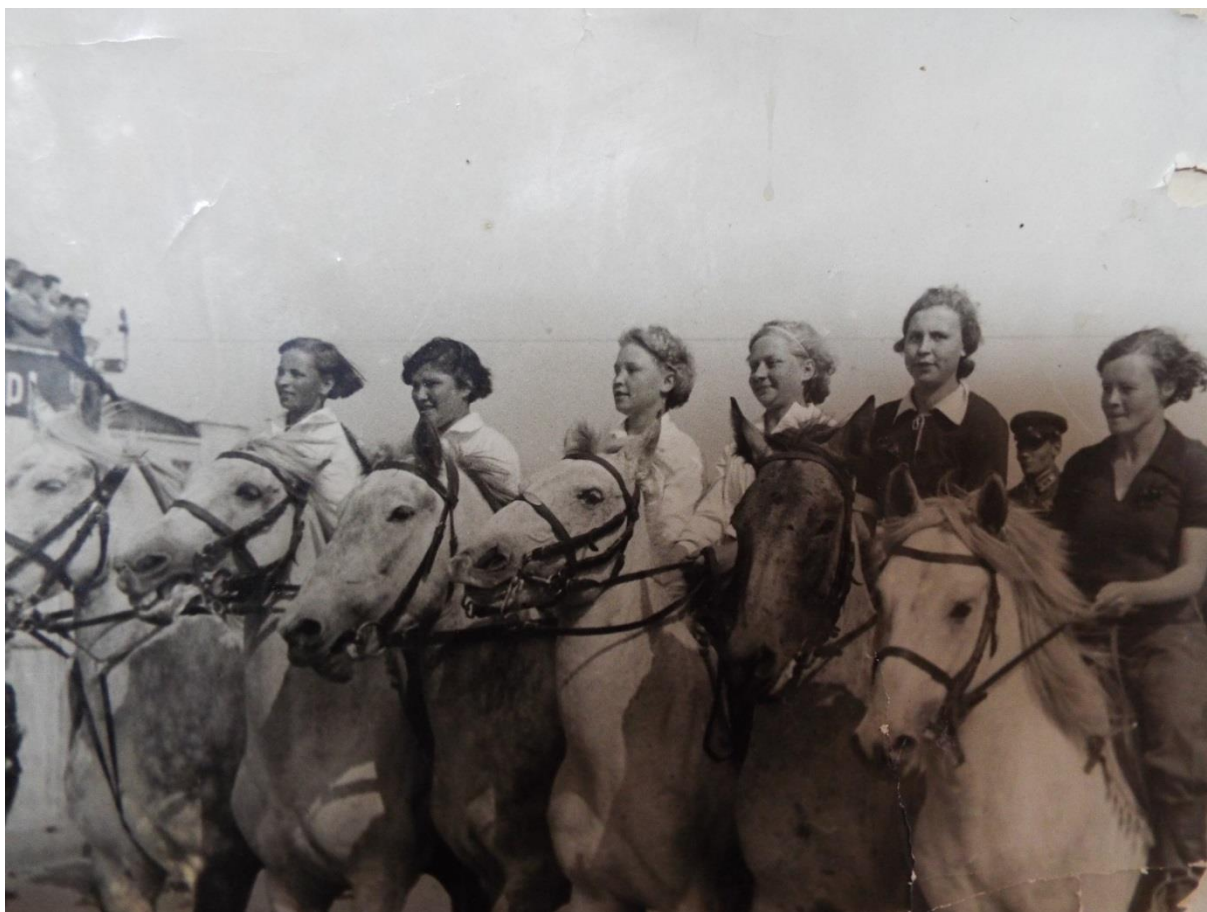
Парад в Свердловске 1 мая 1940 г.

С ее слов, до казачьей столицы добирались полтора месяца. Коней везли в товарных вагонах. Кони, конечно, застоялись, питались неполноценно, выгул почти отсутствовал. Прибыли на соревнования под самое начало. Приветствовал участников слета кавалеристов сам прославленный маршал Советского Союза, легендарный герой Гражданской войны, организатор и создатель Первой конной Армии Семен Михайлович Буденный.