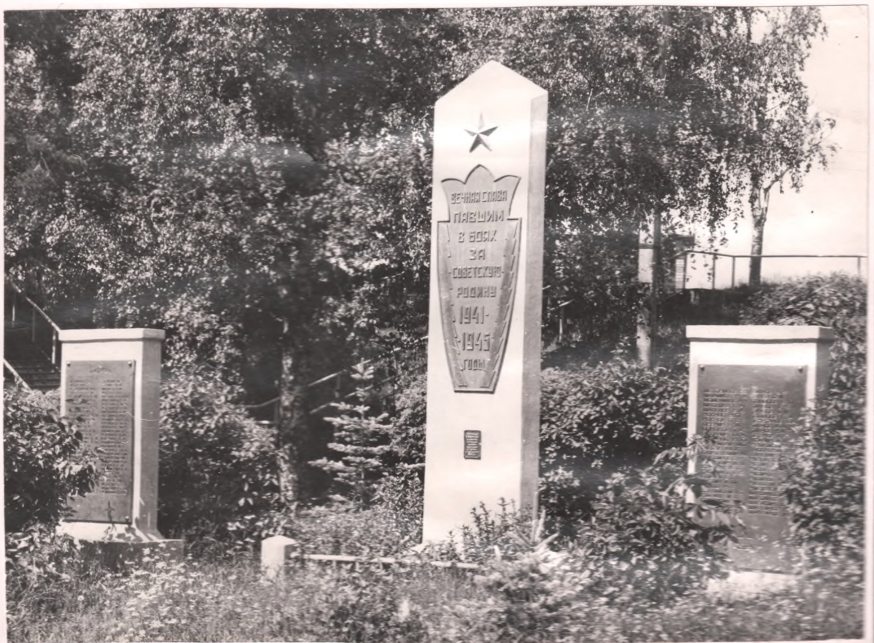
Обелиск Очерским машиностроителям, погибшим за Родину.