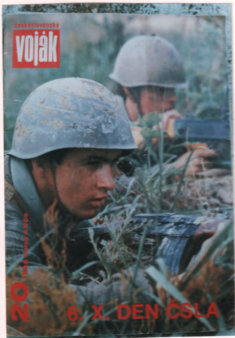
Так называется статья в журнале "Чехословацкий воин" № 20 от 1986 г.