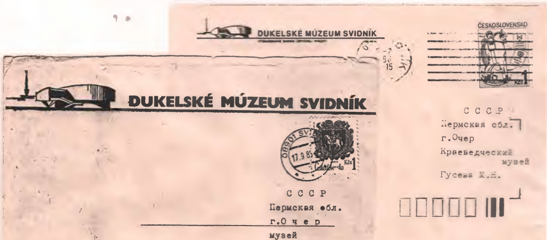
СССР Пермская обл. г. Очер Краеведческий музей Гусева К.В.