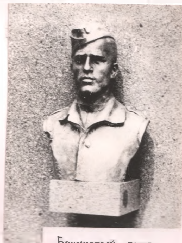
Бронзовый бюст Героя ЧССР Рудольфа Ясиока на аллее Героев