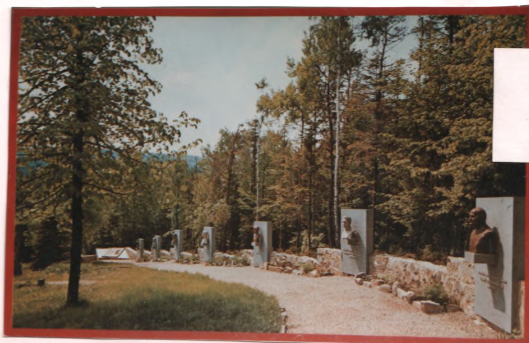
Аллея Героев мемориального музея Дуклы