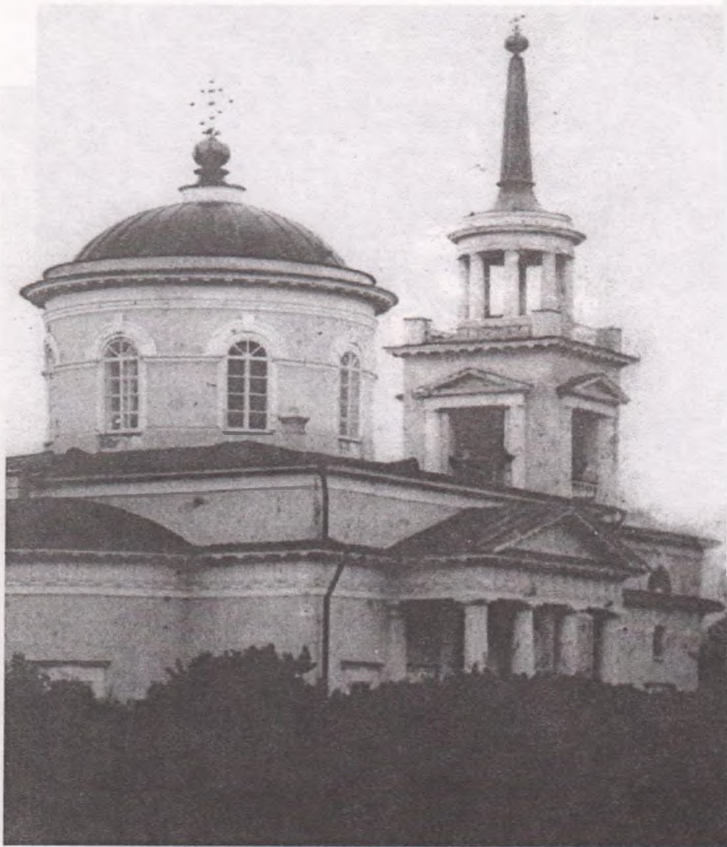
Михаило-Архангельская церковь г. Очер. Начало 20 века.