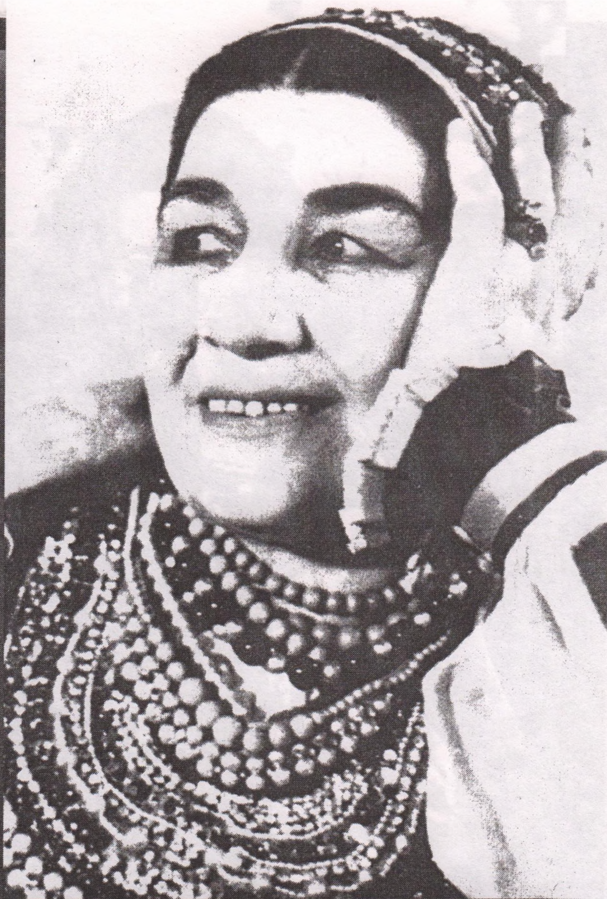
Лидия Андреевна Руссланова

Учредительница и первый министр Индустрии.