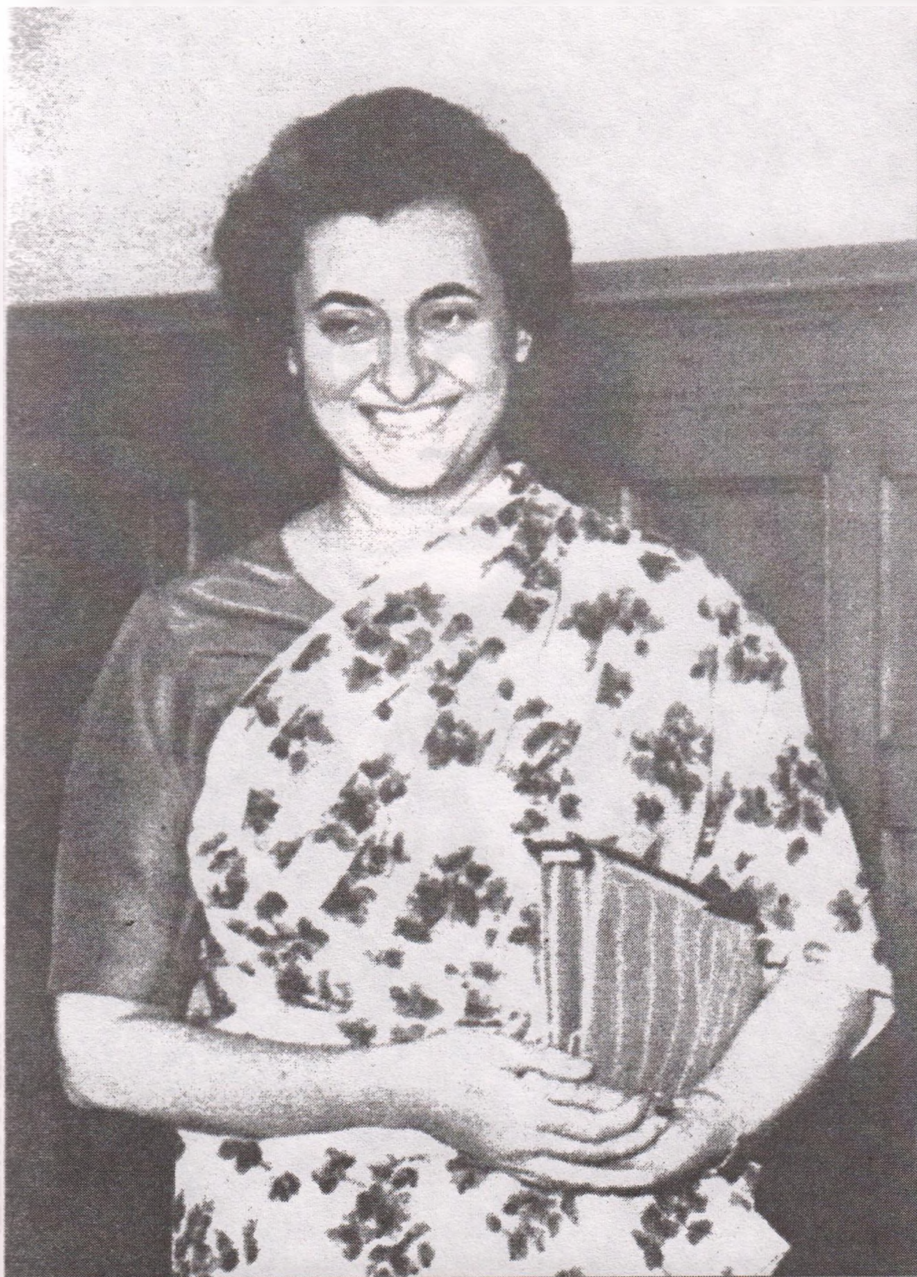
Индира Ганди премьер-министр Индии.