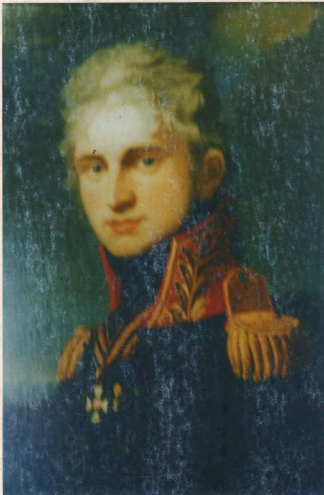
Граф Павел Александрович Строганов в битве под Краоном 7 марта 1814 года командовал российскими войсками