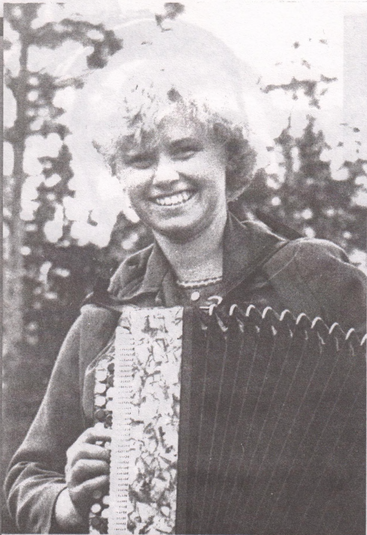
Автопортрет. 1969 год