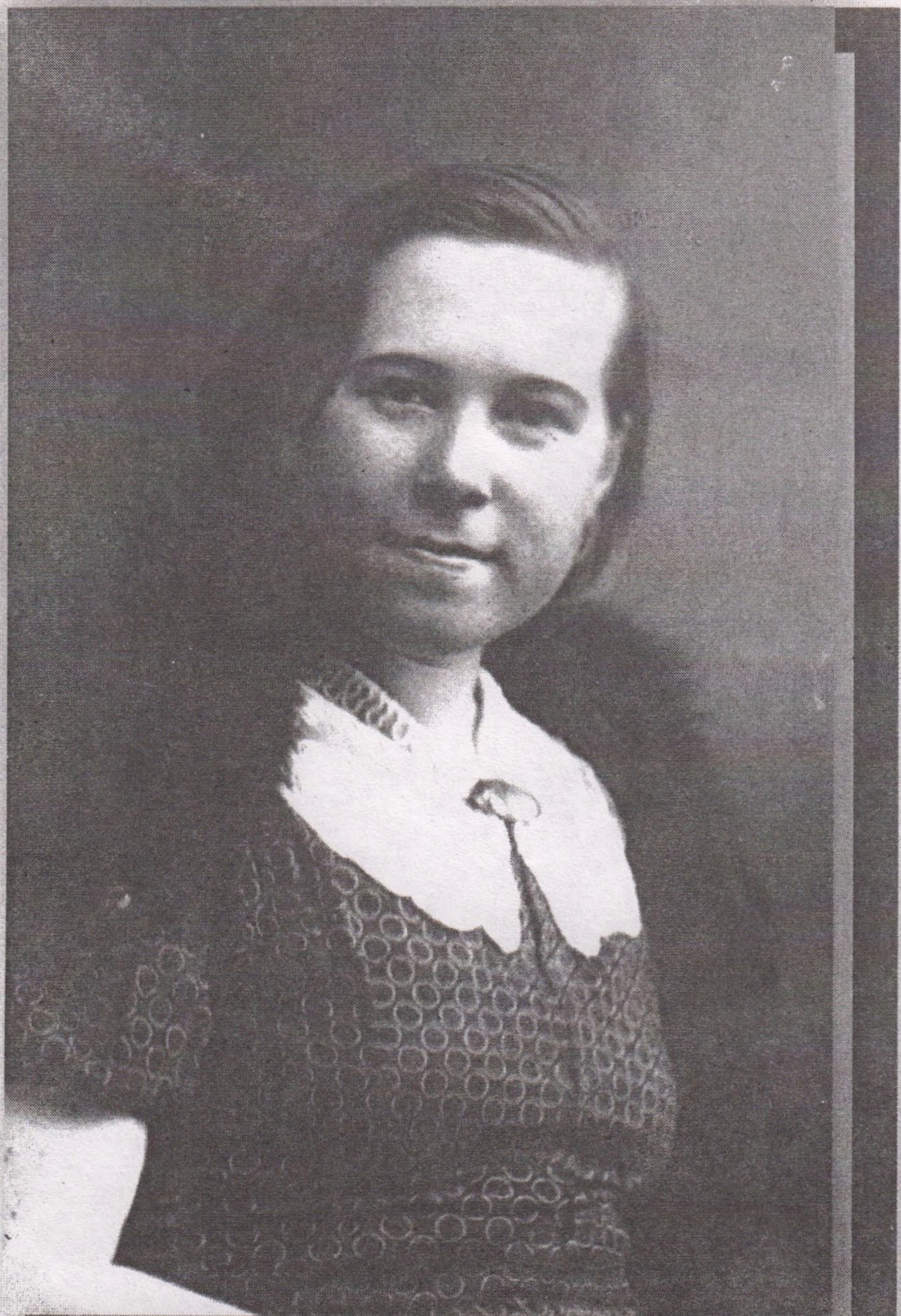
Мама. 1940 год.