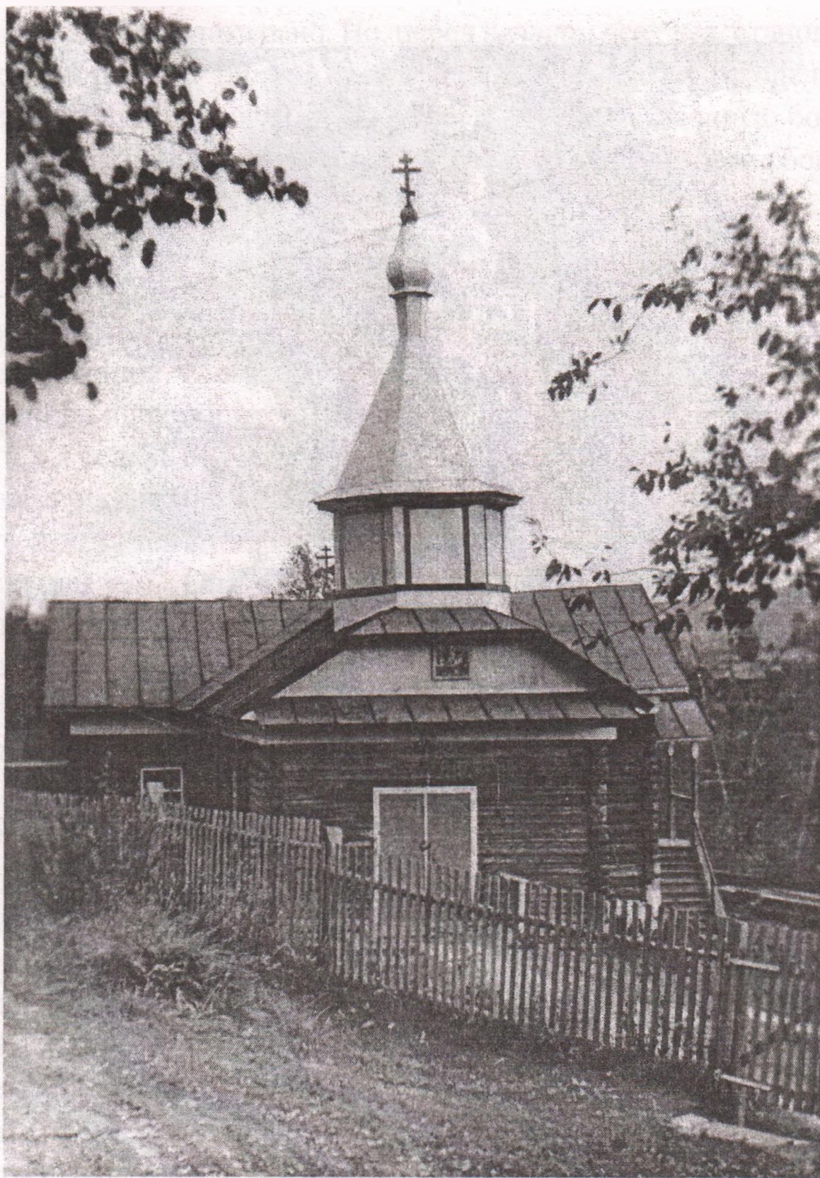
Храм Успения Пресвятой Богородицы в Бурдино, 1985 год.