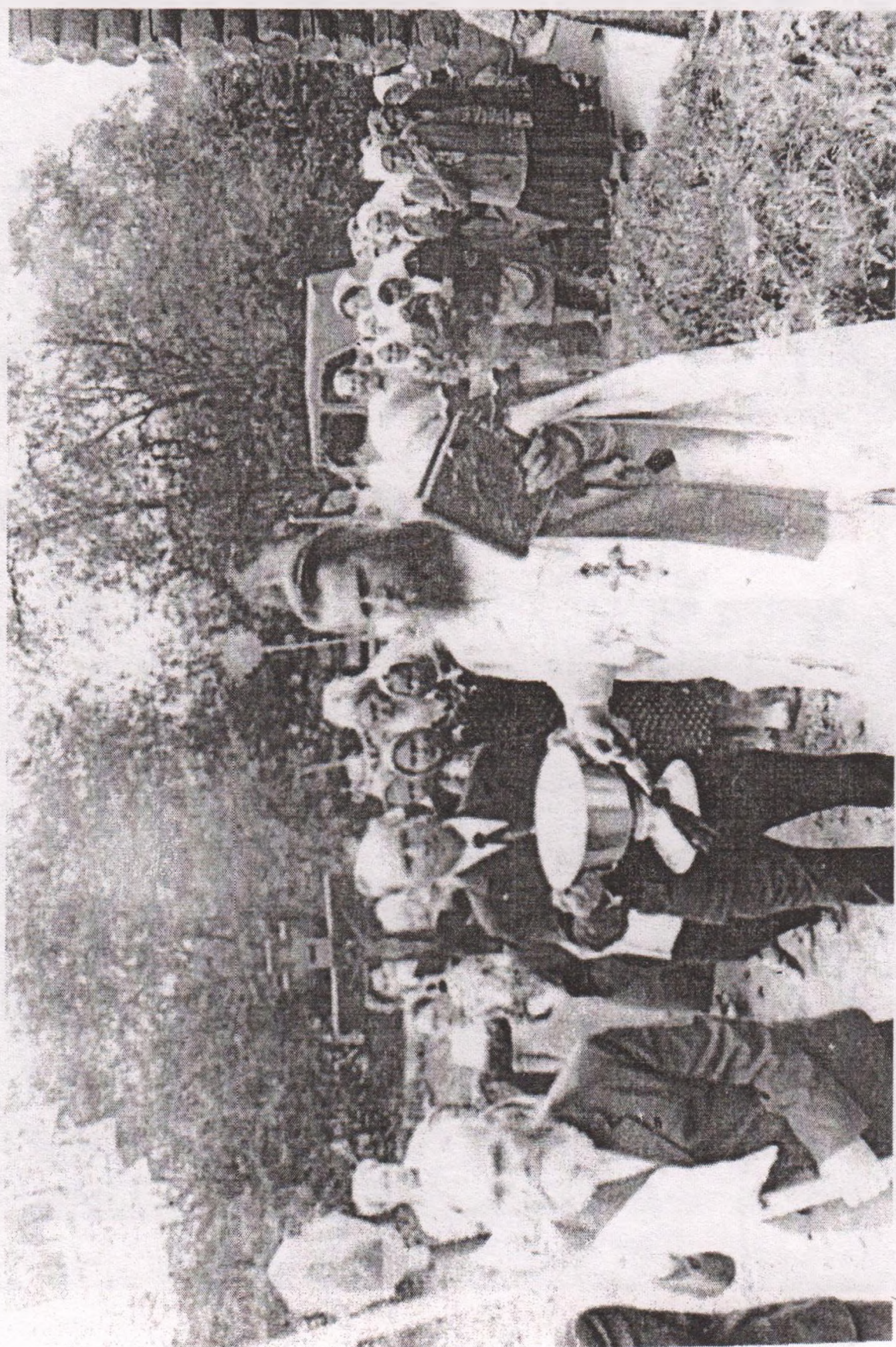
Освящение храма, 4 июля 1981 года.