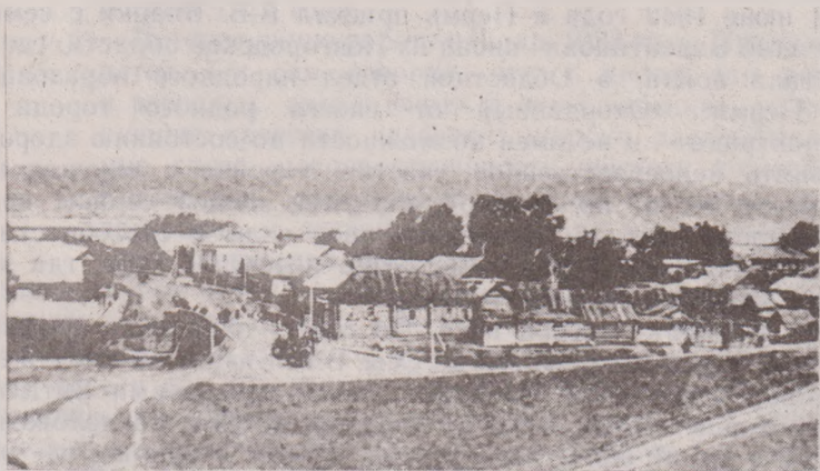
Нижняя часть Осы (ниже затопления)