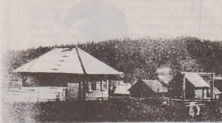
«Наша изба у околицы дер. Заводчик Верх-Давыдовского с/сов. Осинского р-на Моло-товской обл.

Август 1943 г. (из дневника В.В. Бианки).