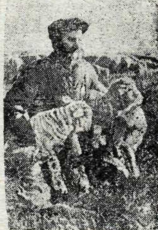
Совхоз племенного овцеводства № 22 (Ставропольский край) выращивает породу „советский рамбуль“.

В целях безусловного выполнения плана хлебозаготовок к годовщине Великого Октября, обком ВКП(б) объявил с 25 октября по 5 ноября ударный предоктябрьский декадник по завершению хлебозаготовок в колхозах. Задача секретарей парторганизаций, руководителей колхозов, советов, МТС в период ударной декады — мобилизовать все силы на окончание скирдования, обмолота хлебов, выполнения плана хлебозаготовок и заготовок картофеля в каждом колхозе.