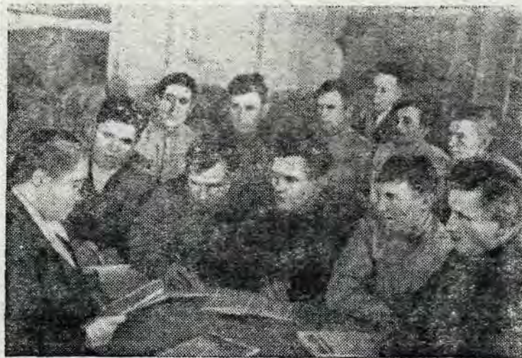
Агитатор за работой.