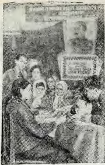
Агитатор у избирателей