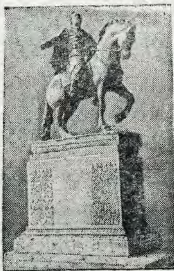
Проект памятника основателю Москвы Юрию Долгорукому. Работа скульптора Г. Моговилова.

за независимость Родины. Московское пожарное подполье патристический гнев народа и явилось поворотным моментом в ходе Отечественной войны 1812 г.