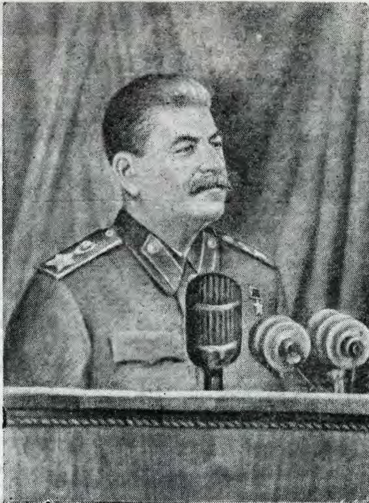
Творец Конституции — И. В. СТАЛИН