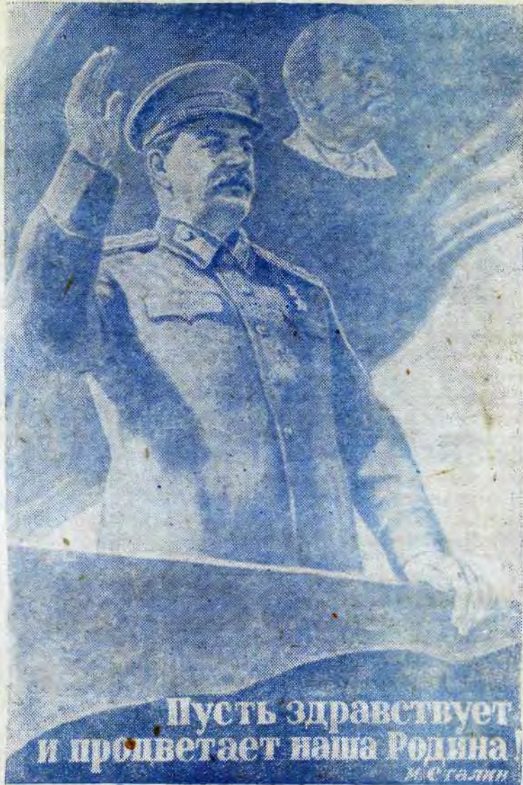
Плакат худ. Тоидзе, выпущенный издательством «Искусство».

Отдадим свой голос за луч- ших людей страны, за могуче- ство и процветание нашего Великого государства!