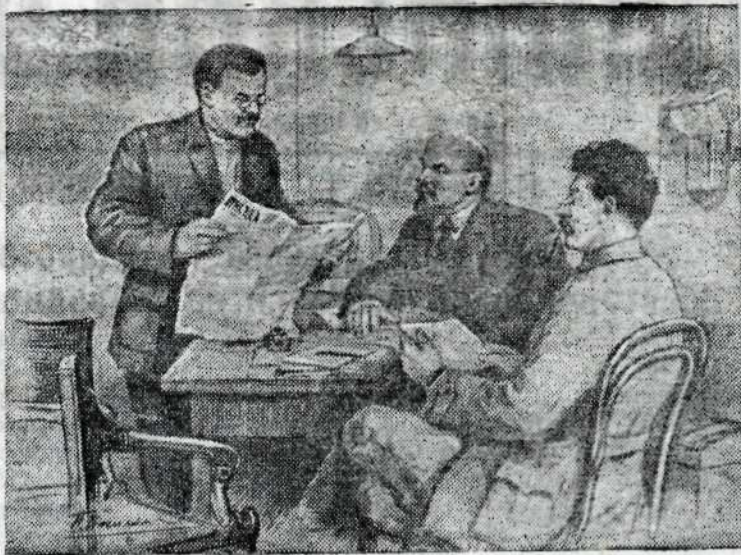
В. И. Ленин, Н. С. Хрущев и В. М. Молотов в редакции «Правды».

После победоносного завершения войны, после того, как в этой войне полностью востор-