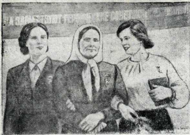
Плакаты художника П. Голубь, выпущенный издательством «Искусство».