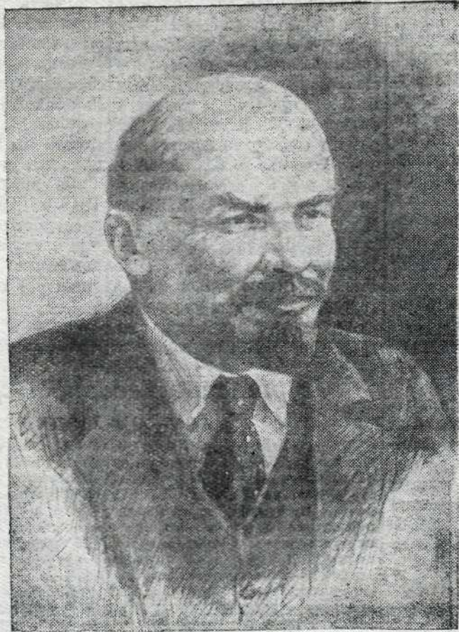
В. И. Ленин

Рисунок заслуженного деятеля искусств П. Васильева.