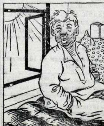
Солнце припекает — он опять отдыхает.