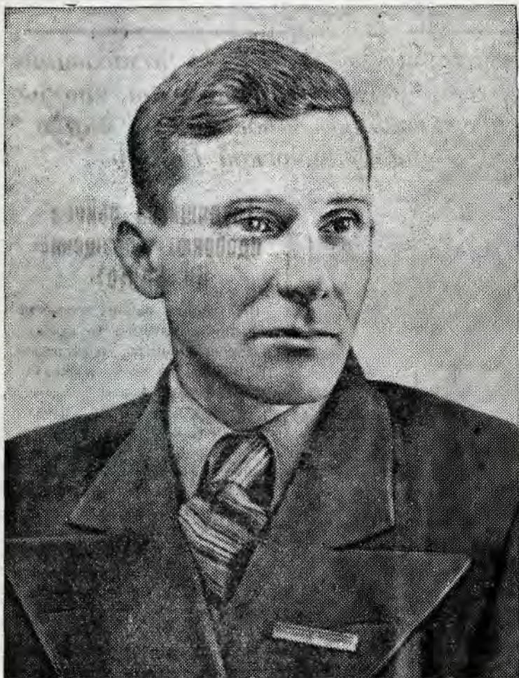
Молотовский избирательный округ № 217 по выборам в Совет Союза

ГОЛОСУЯ ЗА КАНДИДАТОВ БЛОКА КОММУНИСТОВ И БЕСПАРТИЙНЫХ, ИЗБИРАТЕЛИ БУДУТ ГОЛОСОВАТЬ ЗА ТО, ЧТОБЫ НАША СОЦИАЛИСТИЧЕСКАЯ РОДИНА И ВПРЕДЬ БЫЛА МОГУЧЕЙ И СВОБОДНОЙ, ЧТОБЫ НАШЕ СОВЕТСКОЕ ГОСУДАРСТВО БЫЛО СИЛЬНЫМ И НЕПОБЕДИМЫМ.