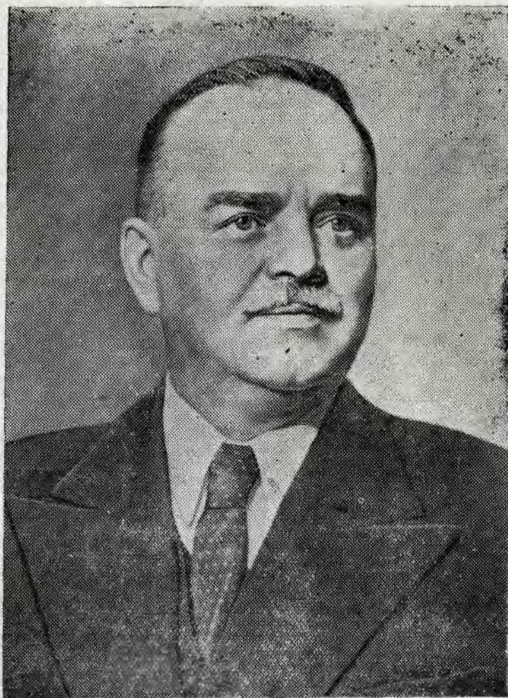
Свердловский избирательный округ № 17 по выборам в Совет Национальностей

оруженным Силам СССР. На агитпунктах проводятся беседы, доклады с избирателями. В цехах заводов, артелей выпущены специальные номера стенок газет.