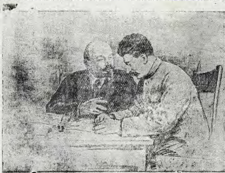
Беседа В. И. Ленина с И. В. Сталиным.

Все, что добыто и завоевано трудящимися СССР после смерти Ленина, — все это завоевано под непобедимым ленинским знаменем, под гениальным руководством Сталина. Имена Ленина и Сталина слиты воедино в сознании всего трудящегося человечества.