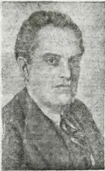
В. В. КУЙБЫШЕВ

Выдающийся организаторский талант В. В. Куйбышева в полной мере развернулся после победы Великой Октябрьской социалистической революции. Он был одним из организаторов Красной Армии. В 1918 году т. Куйбышев на востоке организовал части Красной Армии для борьбы против белогвардейцев и интервентов. Вместе с М. К. Фрунзе т. Куйбышев осуществил разгром армий Колчака. Совместно с М. В. Фрунзе он стал во главе Туркестанского фронта, красные полки которого помогли народам Средней Азии освободиться от на-