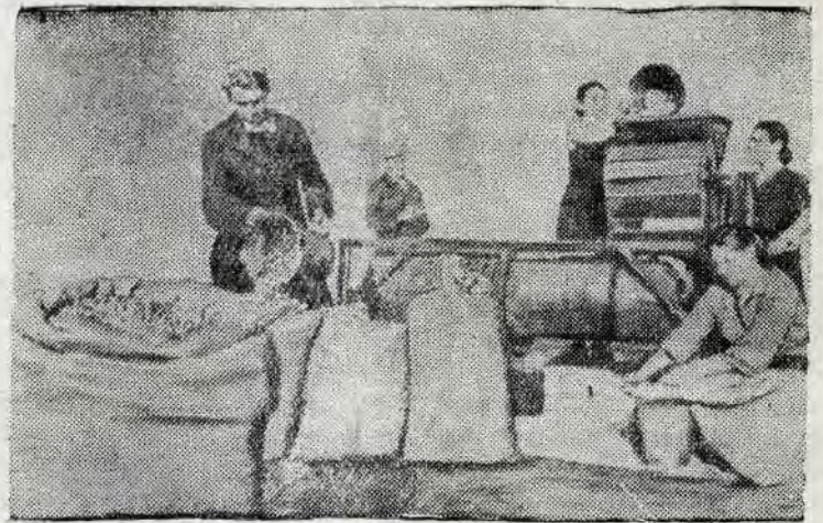
Крымская область. В колхозе имени Кирова, Сакского района идет подготовка семян к весеннему севу.