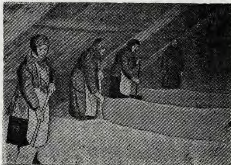
В колхозе «Путь Ленина», Талицкого сельсовета, готовят семена к весеннему севу.

В подготовке к весеннему севу мы уже составили производ-