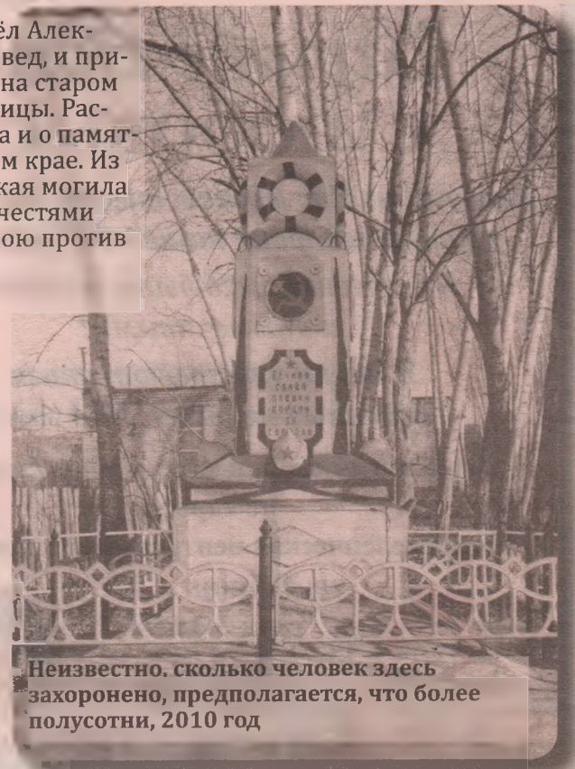
Неизвестно, сколько человек здесь захоронено, предполагается, что более полусотни, 2010 год