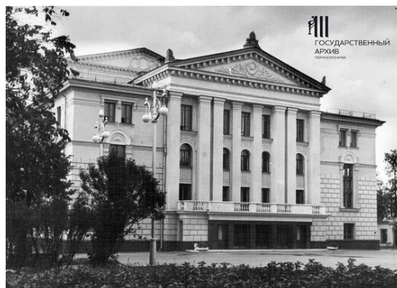
Здание Театра оперы и балета им. П. И. Чайковского (Пермь)

Главные герои книги, написанной в оригинальной художественной форме, - Пермский академический театр оперы и балета им. П.И. Чайковского и его верные служители - артисты оперы и балета, режиссеры, дирижеры, художники, костюмеры - все те, благодаря кому существует театр, живут старые добрые