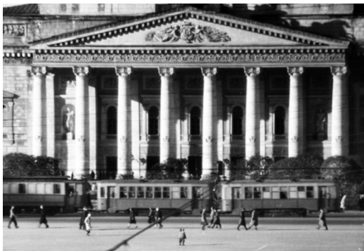
Здание Большого театра (Москва)

1. Волков, С. М. Большой театр. Культура и политика. Новая история / С. М. Волков ; предисл. М. Швыдкого. - Москва : АСТ : Редакция Елены Шубиной, 2018. - 560 с.