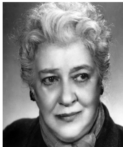
Фаина Георгиевна Раневская (1896-1984)

Это первая книга, в которой представлена не только полная биография актрисы и фактически самого популярного автора российского книжного рынка, но и все самые знаменитые, колкие, остроумные, язвительные афоризмы Фаины Раневской. Только она могли сказать детям, которые окружили ее с радостными возгласами "Муля! Муля!" - "Пионеры, идите в ж*пу".