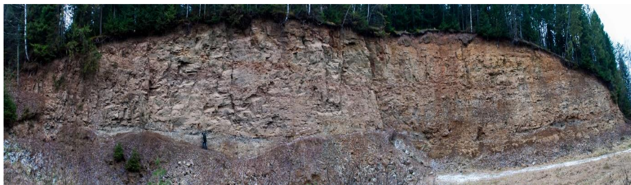
Рис. 2. Панорамный вид на разрез гора Кокуй. Размеры разреза: длина 155м, высота от 1 до 21,5 м.

На месте можно наблюдать и отбирать образцы окаменелостей голосеменных и хвойных растений, которые росли в Очерском районе в Пермском периоде. Это не только познавательно, но и очень интересно, так как можно увидеть, как формировалась наша планета миллионы лет назад.