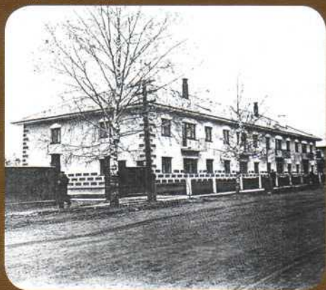
▲ Здание Очёрской библиотеки. 1962 год