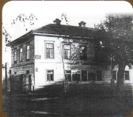
▲ В этом здании располагалась библиотека до 1960 года