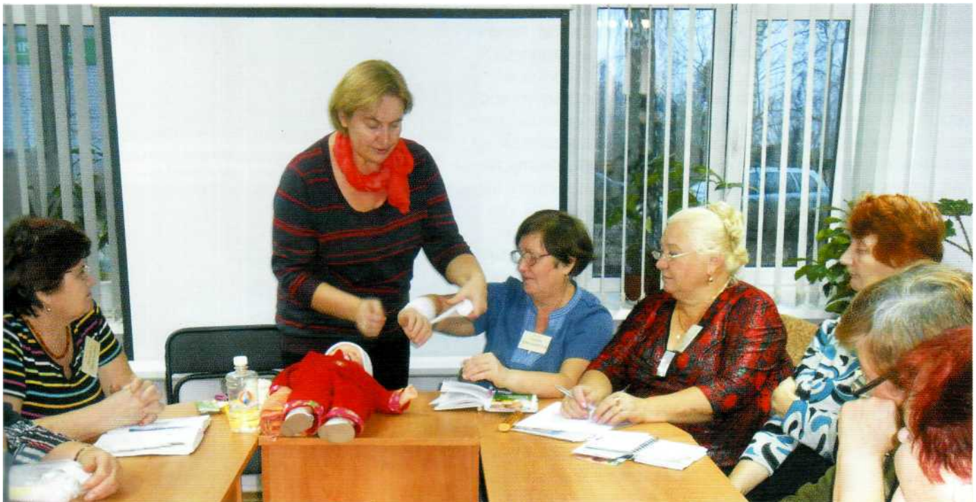
Час здоровья в рамках проекта «Университет пожилых людей»