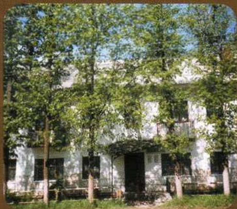
▲ Здание Очёрской библиотеки. 2010 год