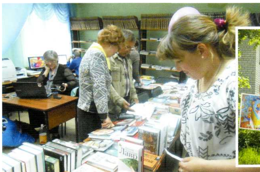
◀ Просмотр литературы в читальном зале