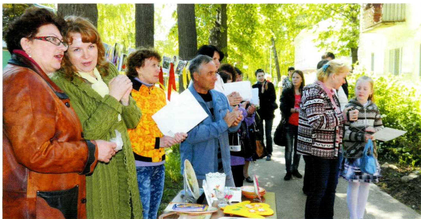
Книжная аллея в юбилей библиотеки

Совсем недавно в библиотеке был реализован проект «Через слово - к добру и свету». Цель проекта в популяризации творчества писателей и поэтов Прикамья и выявлении талант-