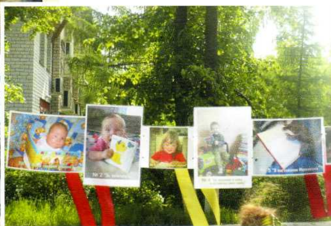
▼ Районный фотоконкурс «Я с книгой открываю мир»

В 2002 году Очёрская районная библиотека получила грант второго областного конкурса социальных и культурных проектов на реализацию масштабного проекта «Информационное пространство - провинциальной молодёжи». Основная цель - предоставить молодёжи полный спектр информационных услуг, создать условия для повышения общего уровня информационной культуры. Именно тогда здесь появился Молодёжный Интернет-центр, для него закуплено оборудование, произведено подключение к сети Интернет, создана локальная сеть.