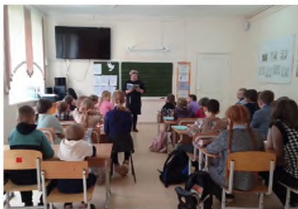
Рисунок 3. Акция «Читаем детям о войне»