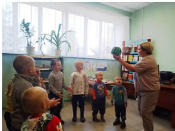
Рисунок 1. Игровая программа «Путешествие в страну Знаний»

На протяжении многих лет библиотека сотрудничает с МБОУ «Нововознесенская основная