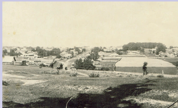
Улица Архангельская, XIX в.