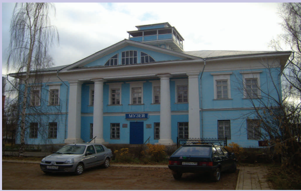
Краеведческий музей им. А.В. Невцетаева (постройка 1843), 2001г.