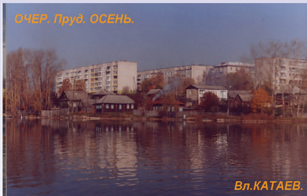
Очёр, конец XX в.