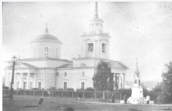
Михайло – Архангельская церковь, XIX в.

Сост.: И. З. Мезенцева