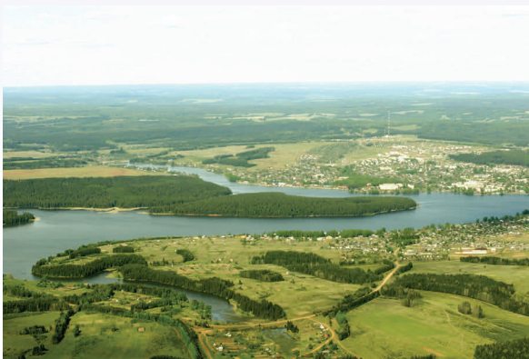
Очёр, 2007 г.