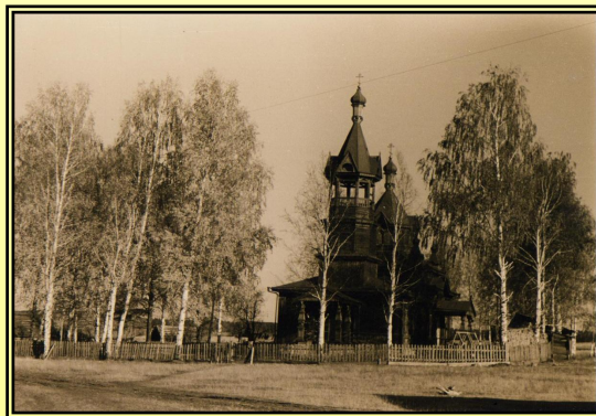
Церковь 50-е года

Люди были очень религиозны. Соблюдались все религиозные праздники. В 1906 году в деревне Рогали была построена православная церковь. В то время церковь занимала особое место. В Спешково была трехклассная земская школа, где преподавались арифметика, чтение, письмо и закон Божий. Закон Божий вел местный священник. Соблюдались все религиозные праздники. Церковный приход был большой, сюда приходили жители со всей округи. В церкви венчали, крестили, отпевали умерших.