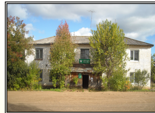
Здание конторы АОЗТ «Спешково»