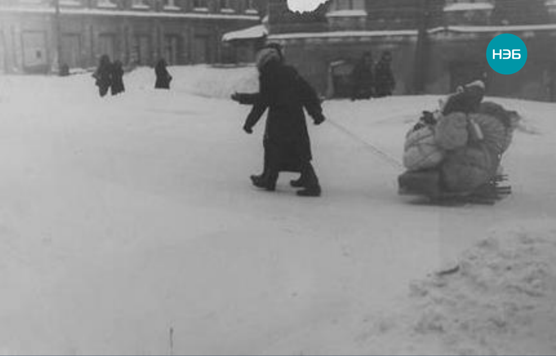
Ленинград в дни блокады. На Финляндский вокзал для эвакуации. Март 1942