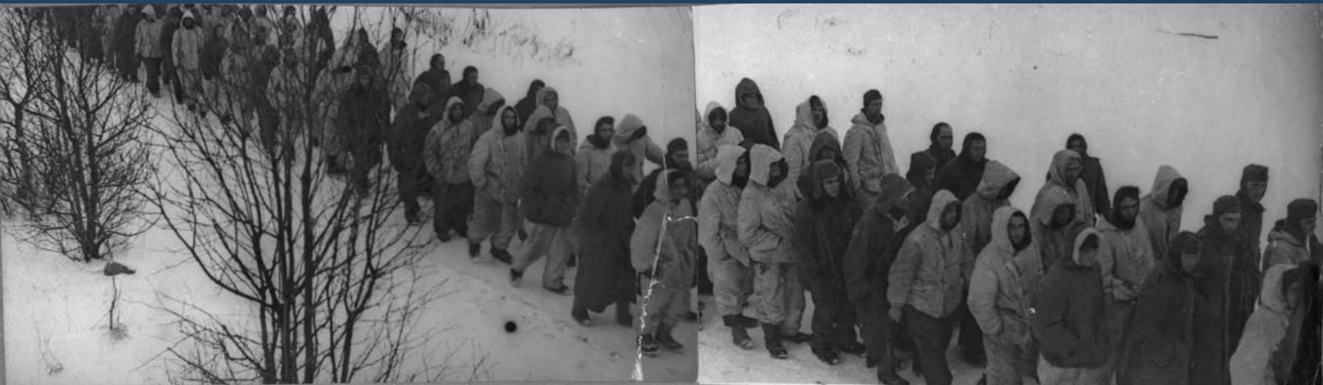
Пленные фашисты, взятые нашими войсками в дни боев за прорыв блокады Ленинграда. Январь 1943 г.