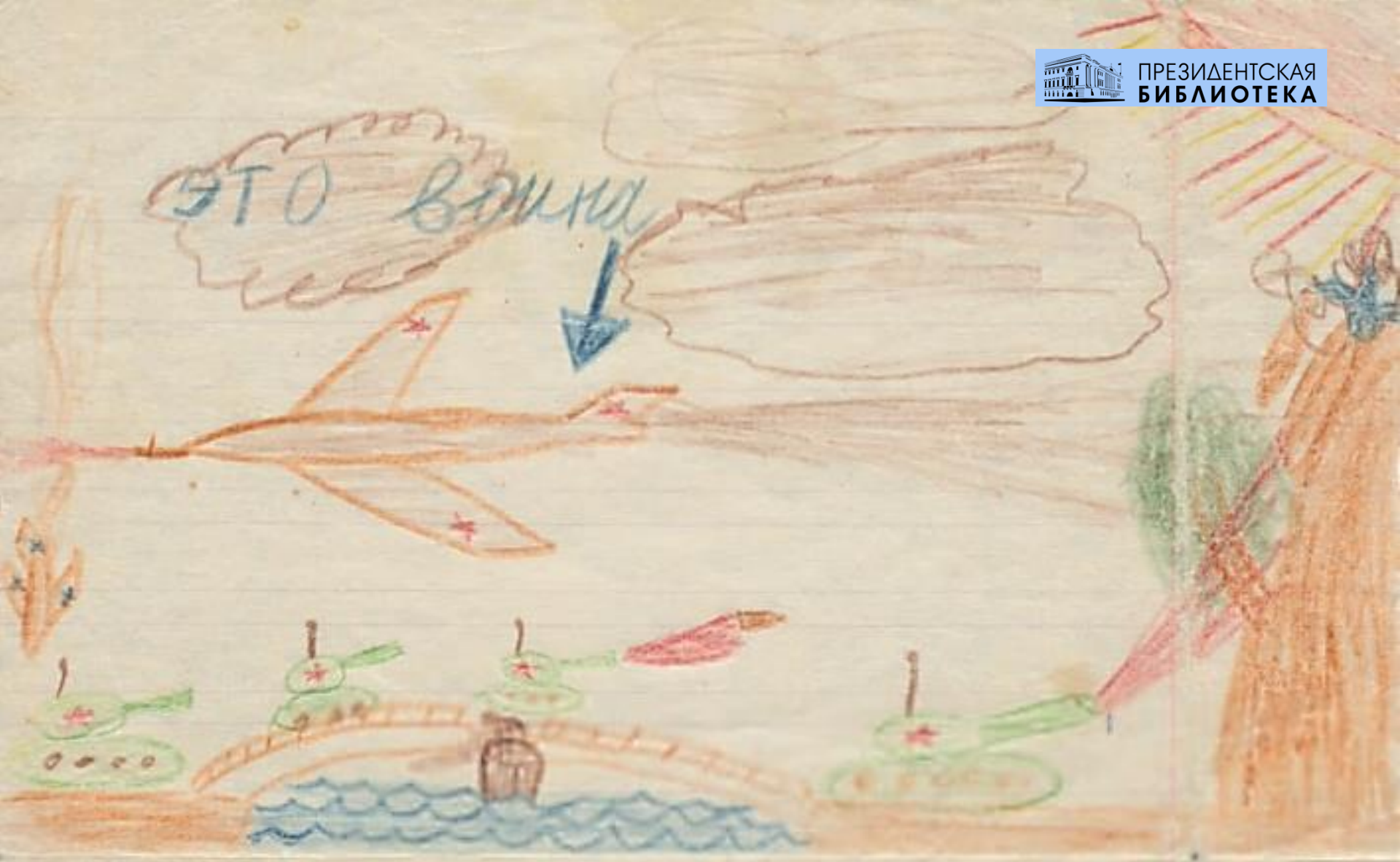
Детский блокадный рисунок (Е. А. Благанин)