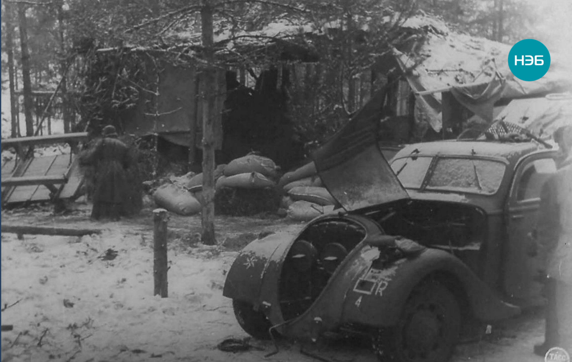
Трофеи, взятые нашими войсками в дни боев за прорыв блокады Ленинграда. Январь 1943 г.