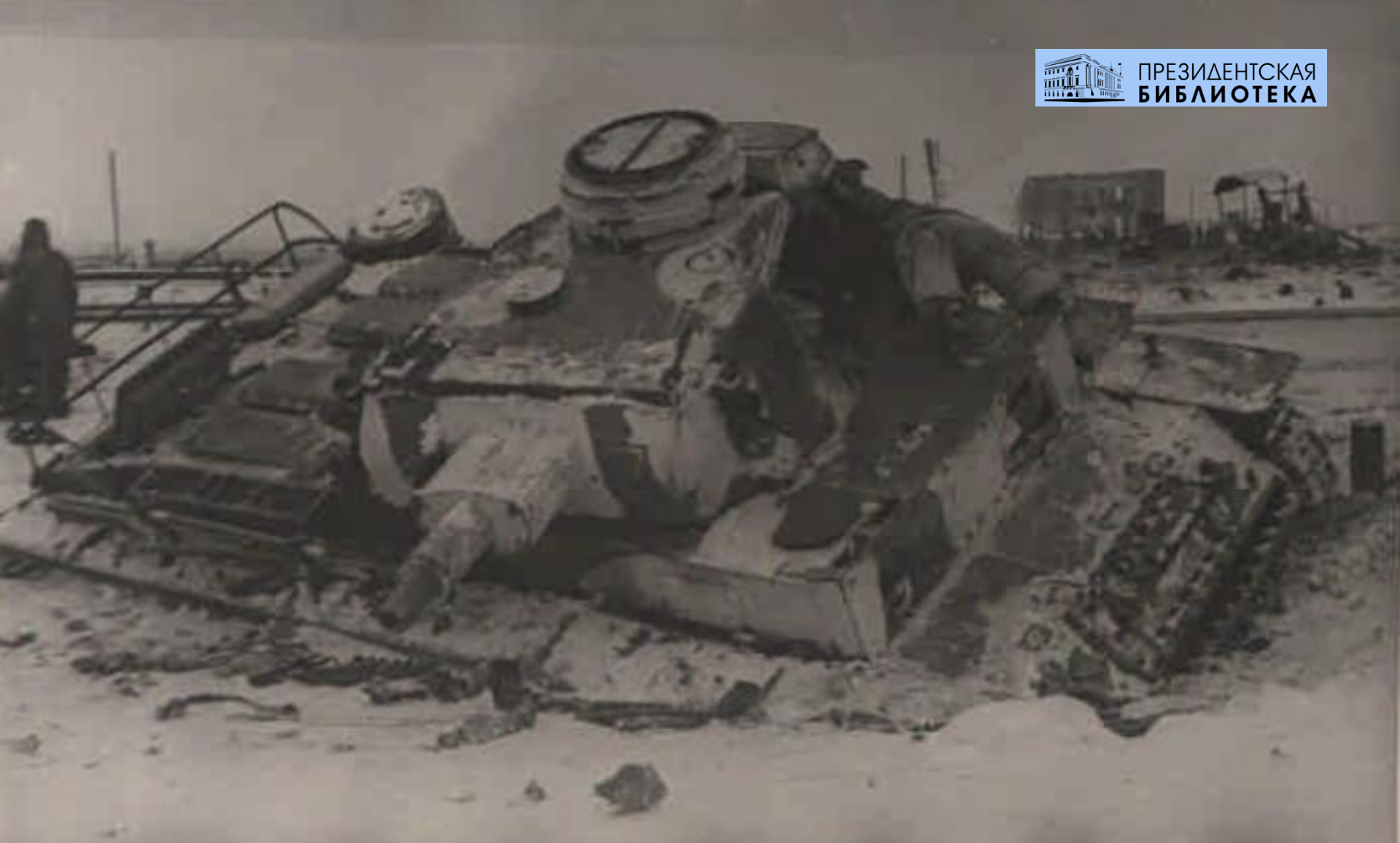
Фотохроника ЛенТАСС, 23 января 1943 . Фото Б. С. Лосева