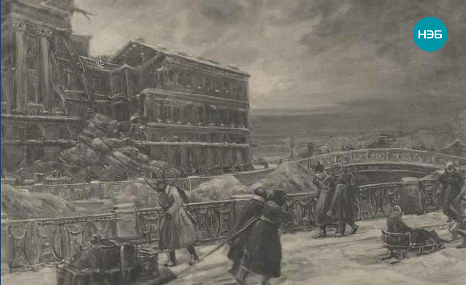
Ленинград в дни блокады 1942 г. Бытовая зарисовка у дома Адамини с живописного оригинала.