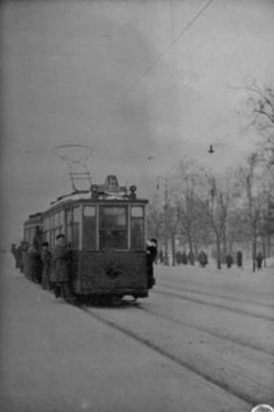
Ленинград в дни блокады. Трамвайный вагон на расчищенном пути. 16 декабря 1941 г.