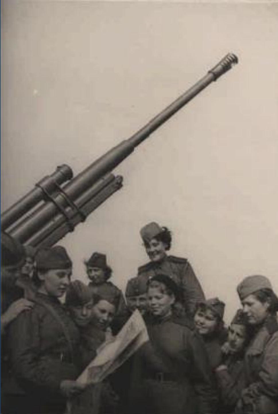
Ленинградский фронт. Девушки-зенитчицы читают свежий номер газеты. 1 мая 1943.