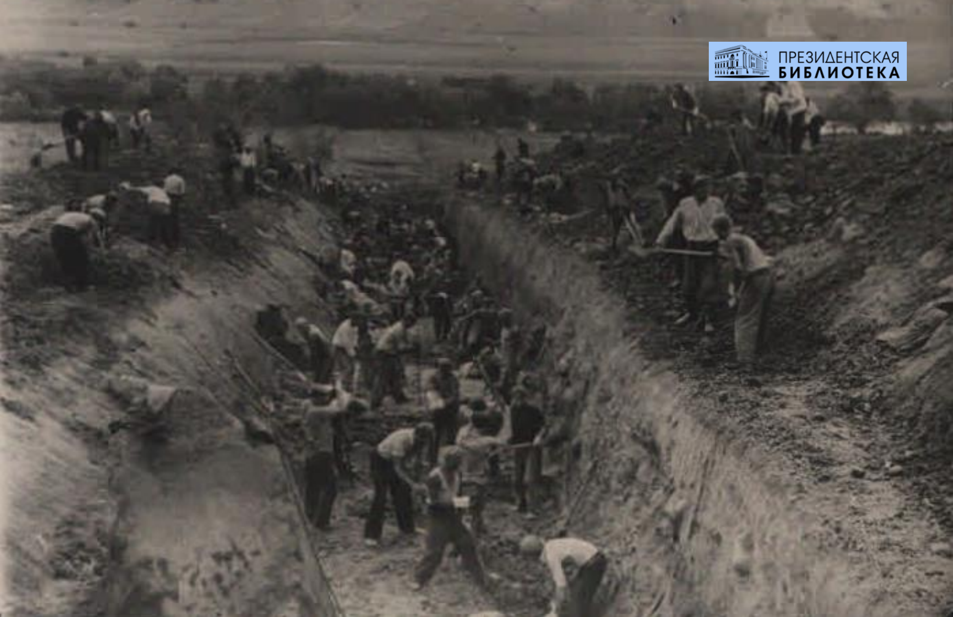
Трудящиеся города Ленина на оборонной стройке, роют противотанковый ров. 10 августа 1943.