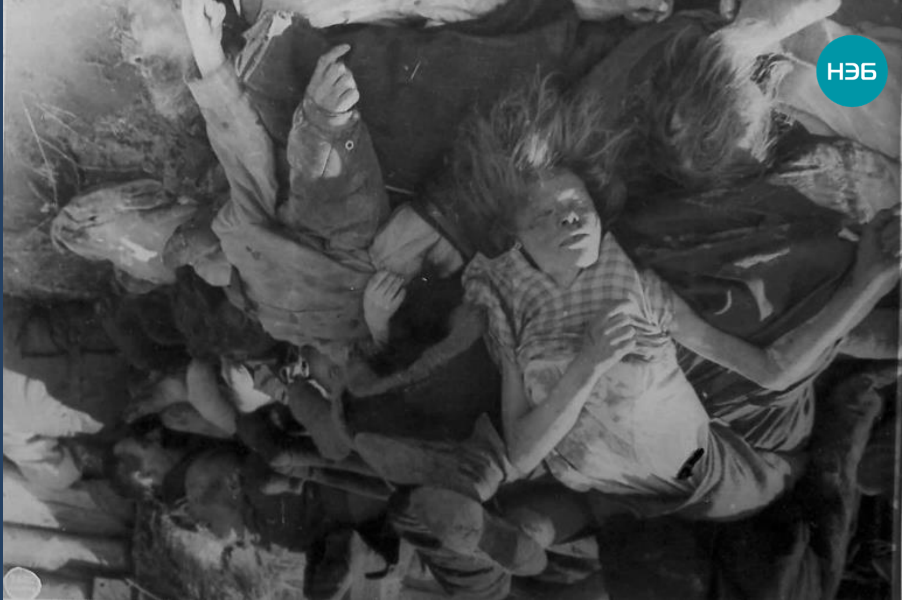
Эвакуация населения Ленинграда. На станции Кабона неперенесшие лишений блокады. 12 апреля 1942.