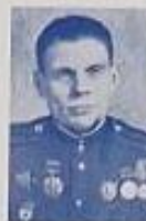
Figure 1. Comparison of the different studies.