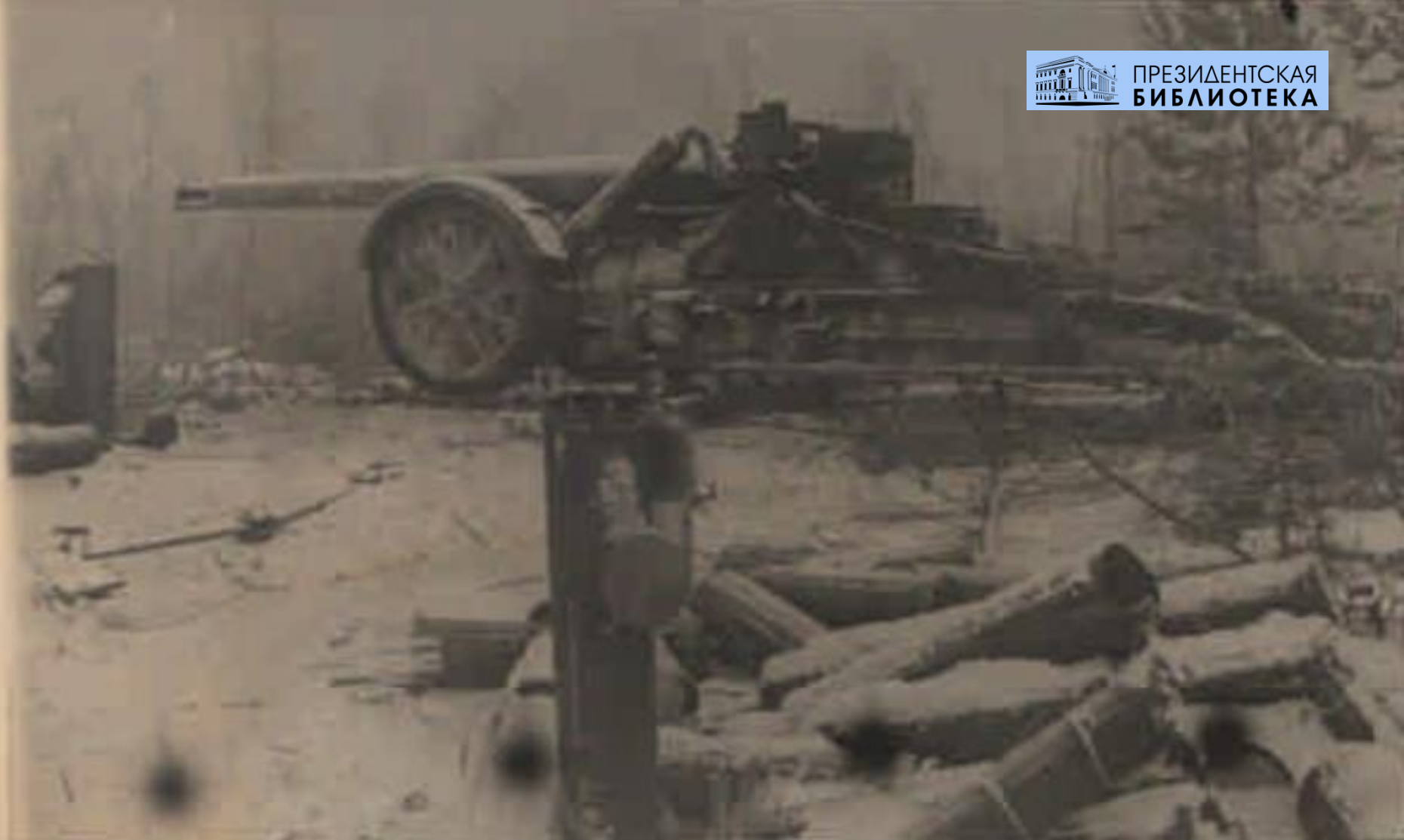
Фотохроника ЛенТАСС, 23 января 1943 . Фото С. Г. Нордштейна