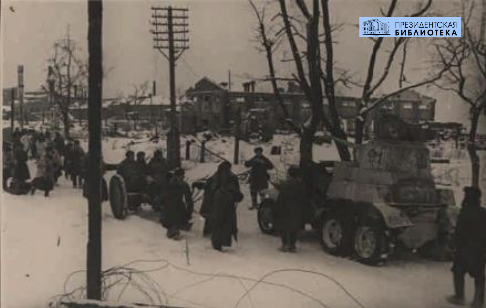
На улицах освобожденного Шлиссельбурга. 6 марта 1943.