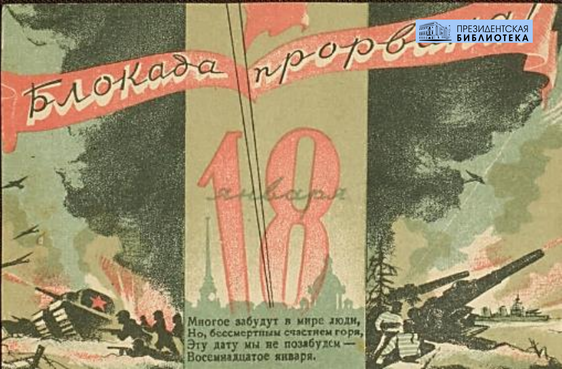
Открытка, художник В. Соколов, стихи Е. Рывиной