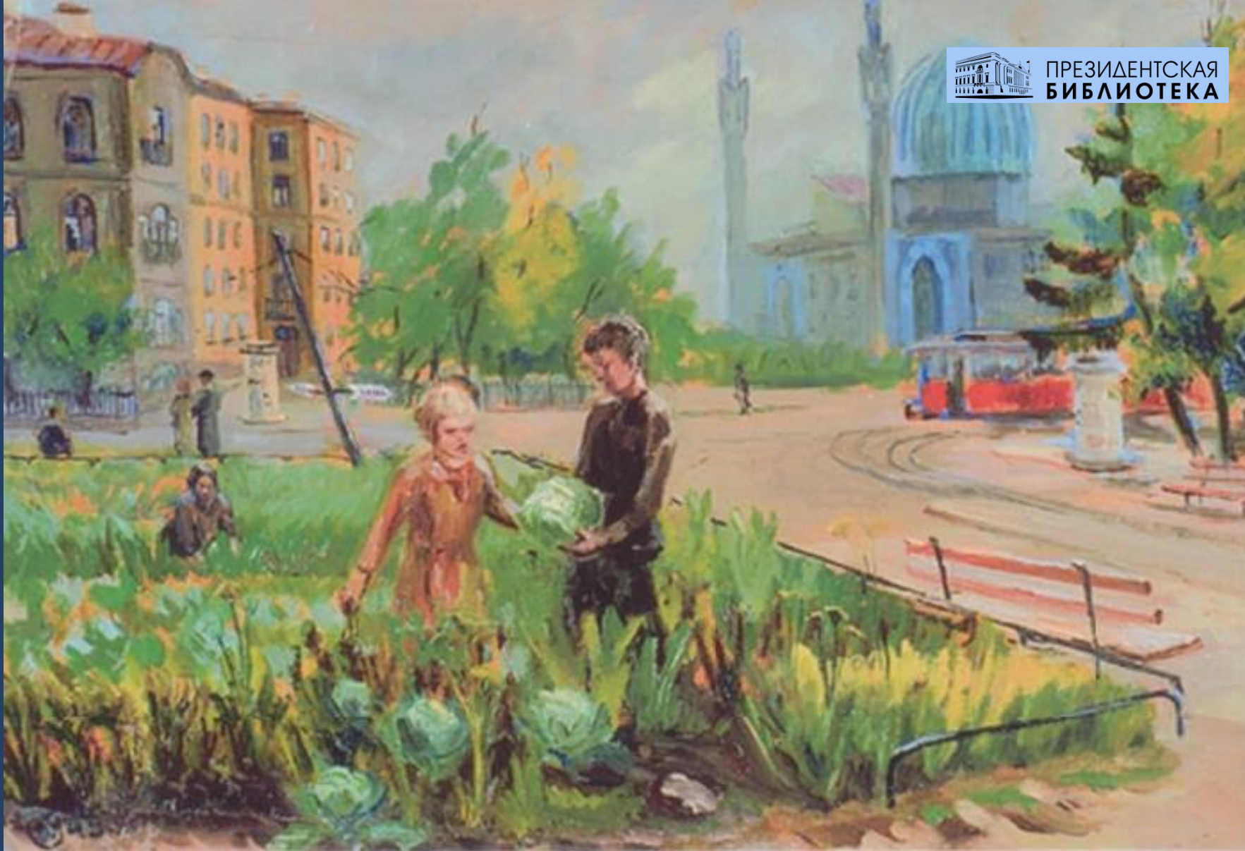
И. К. Скоробогатов Блокадная осень (Картон, масло)