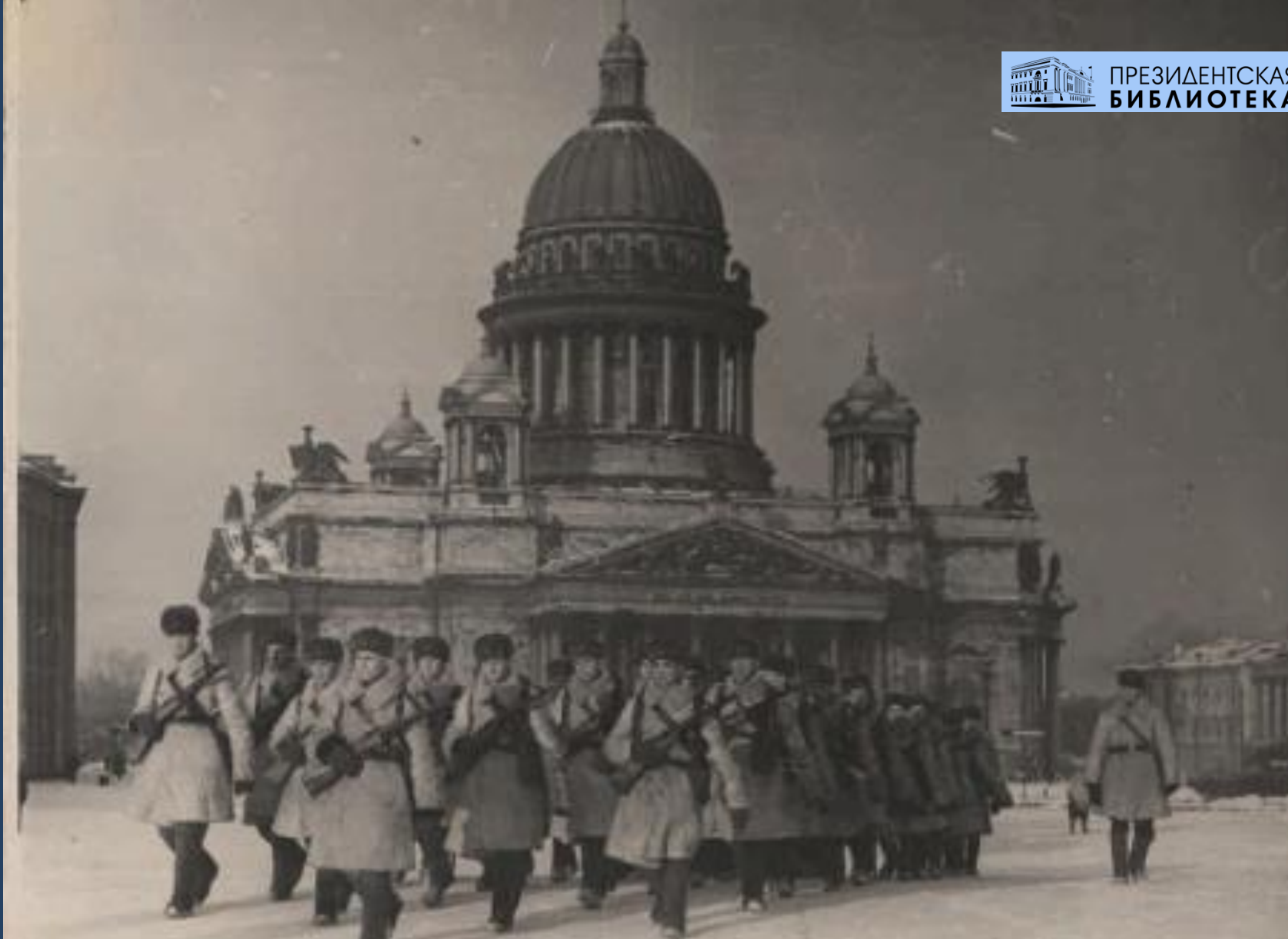
Ленинград в дни Отечественной войны. Подразделение автоматчиков на улицах города. Март 1943.