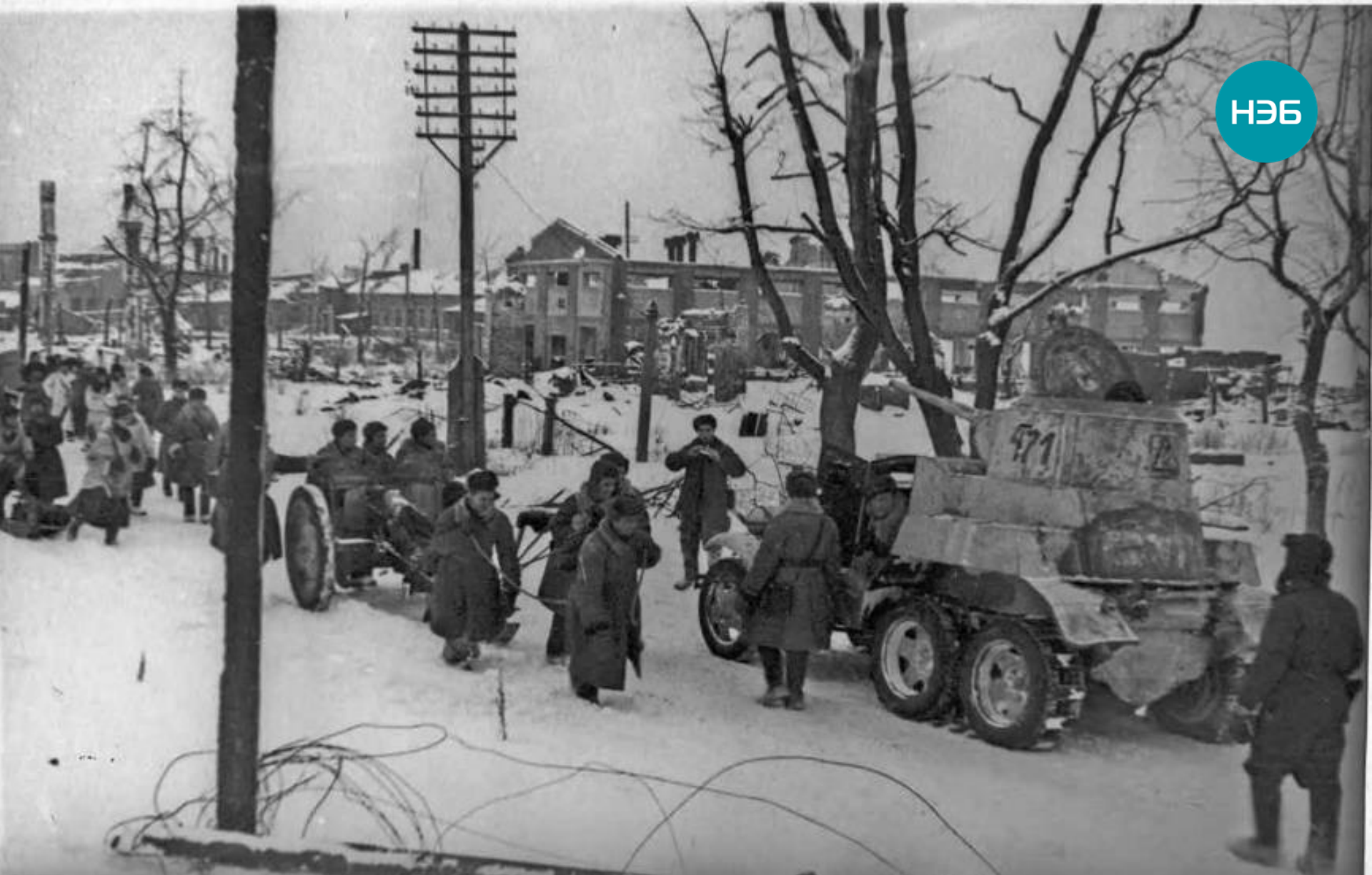
В боях за прорыв блокады. На улицах освобожденного Шлиссельбурга. 20 января 1943.