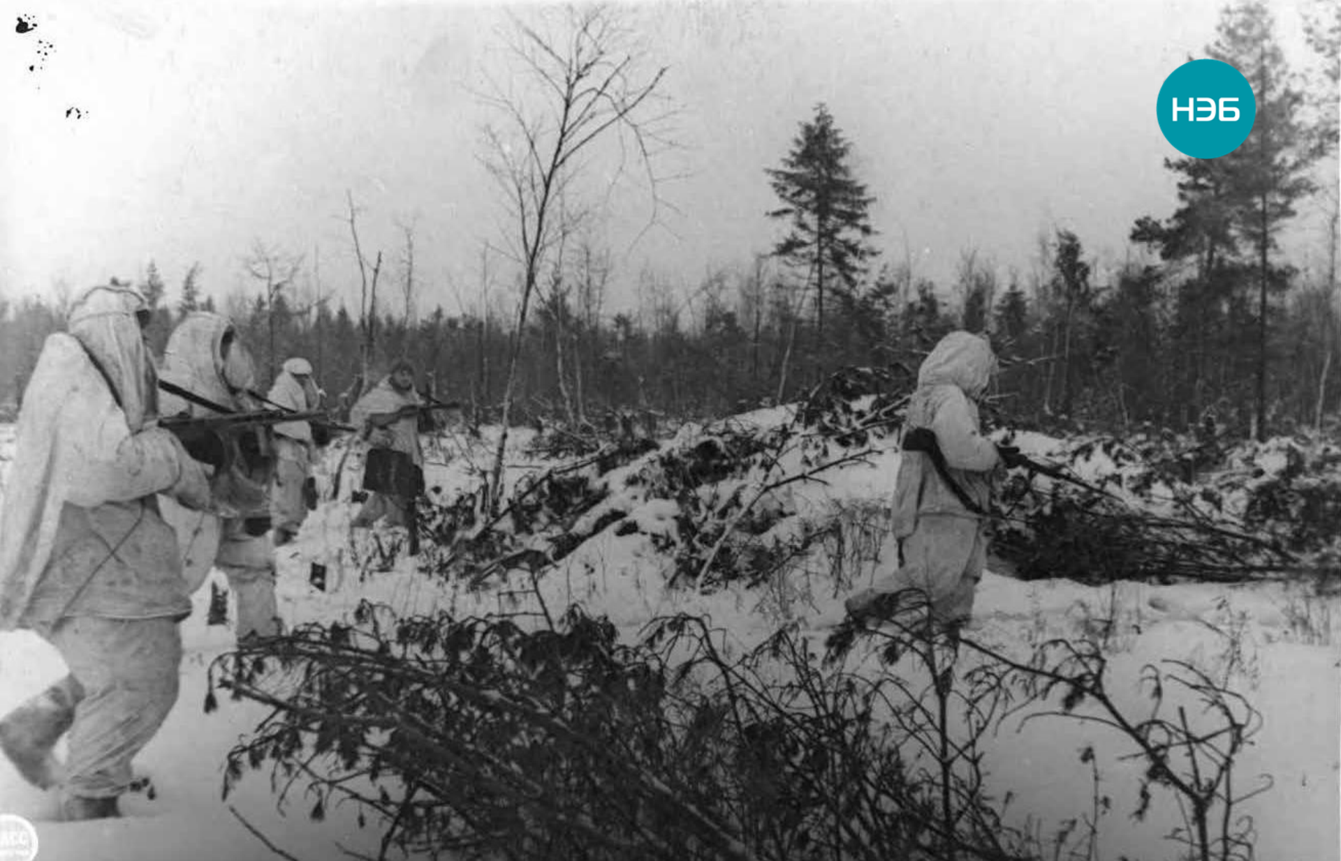
Блокада Ленинграда прорвана. Автоматчики прочесывают лес в районе рабочих поселков. Волховский фронт. Январь 1943 г.