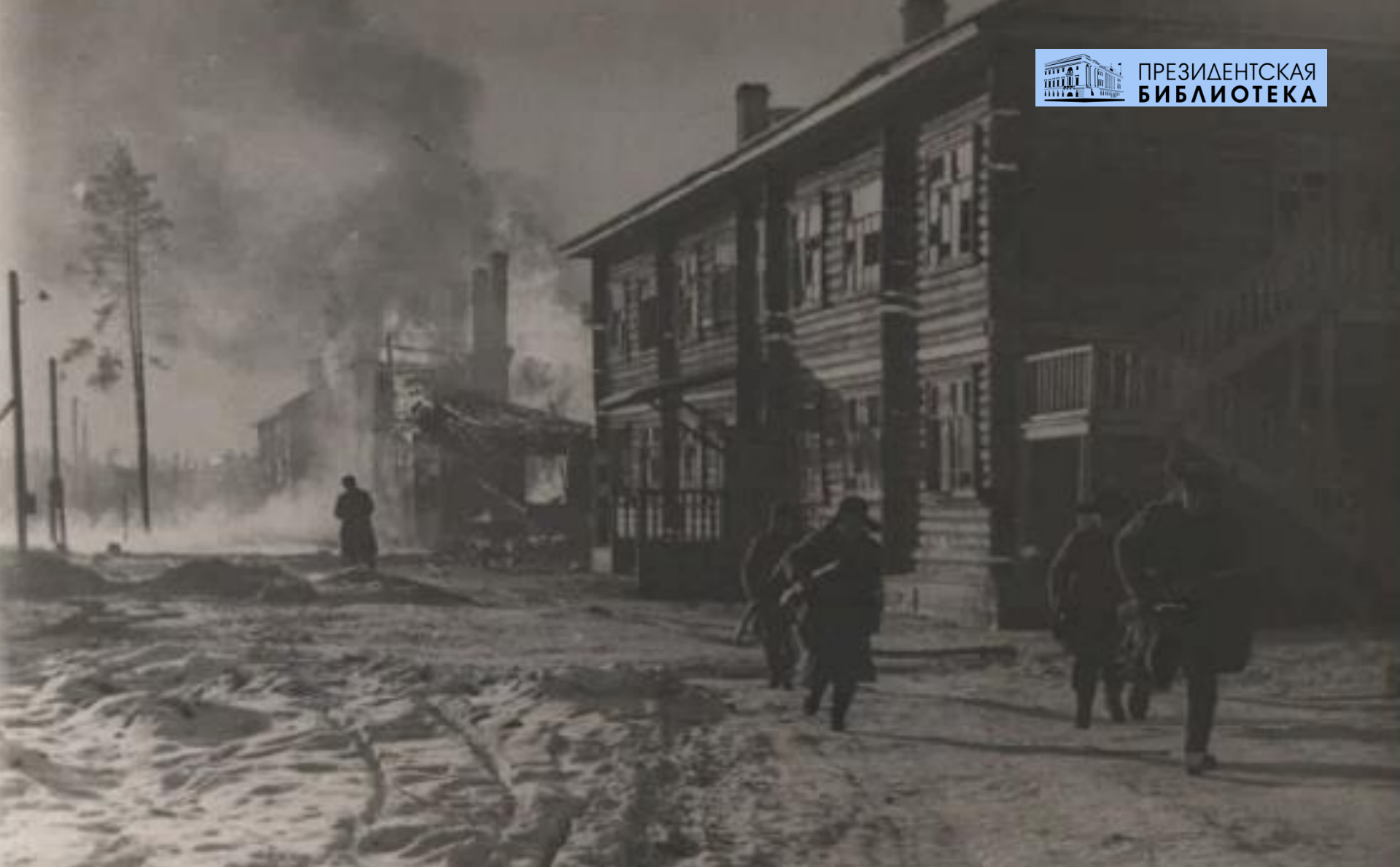
По следам отступающих немцев . 20 февраля 1943.