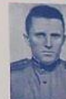
Public Enterprise Group