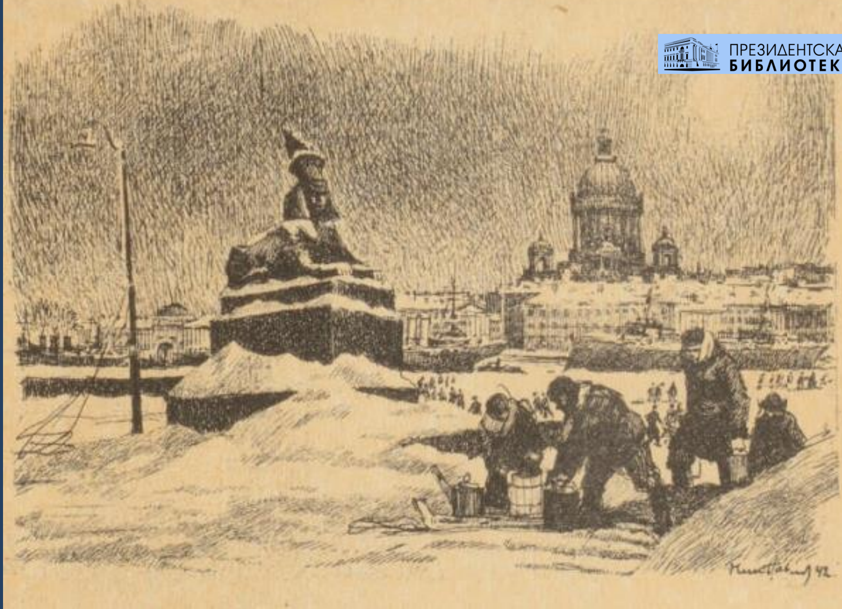
Ленинград в дни Отечественной войны. За водой на Неву. (Зима 1941-42 г.): открытка. Художник Н. А. Павлов.