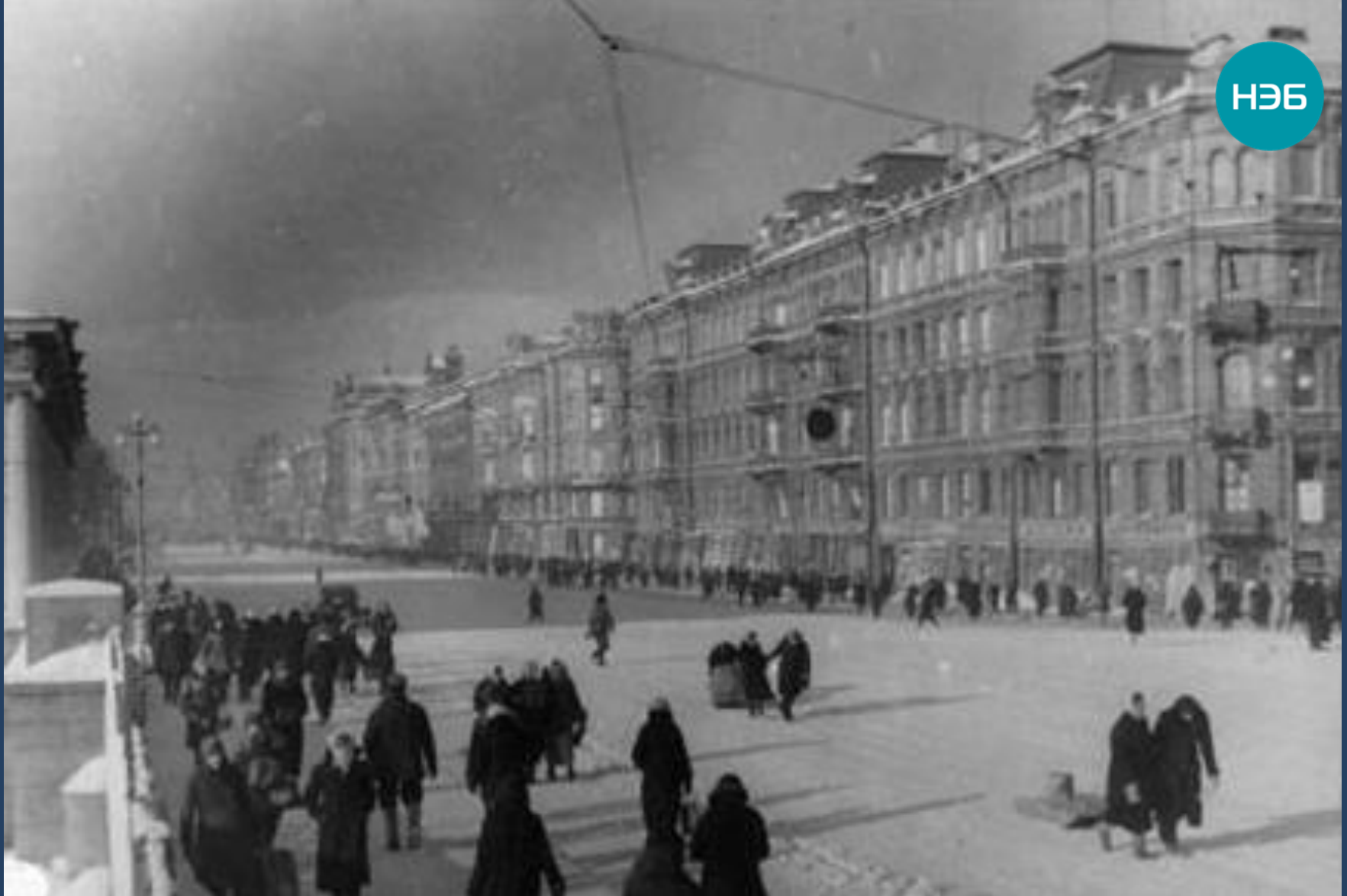
Дни блокады. Проспект 25-го Октября у Аничкова моста. 25 февраля 1942.