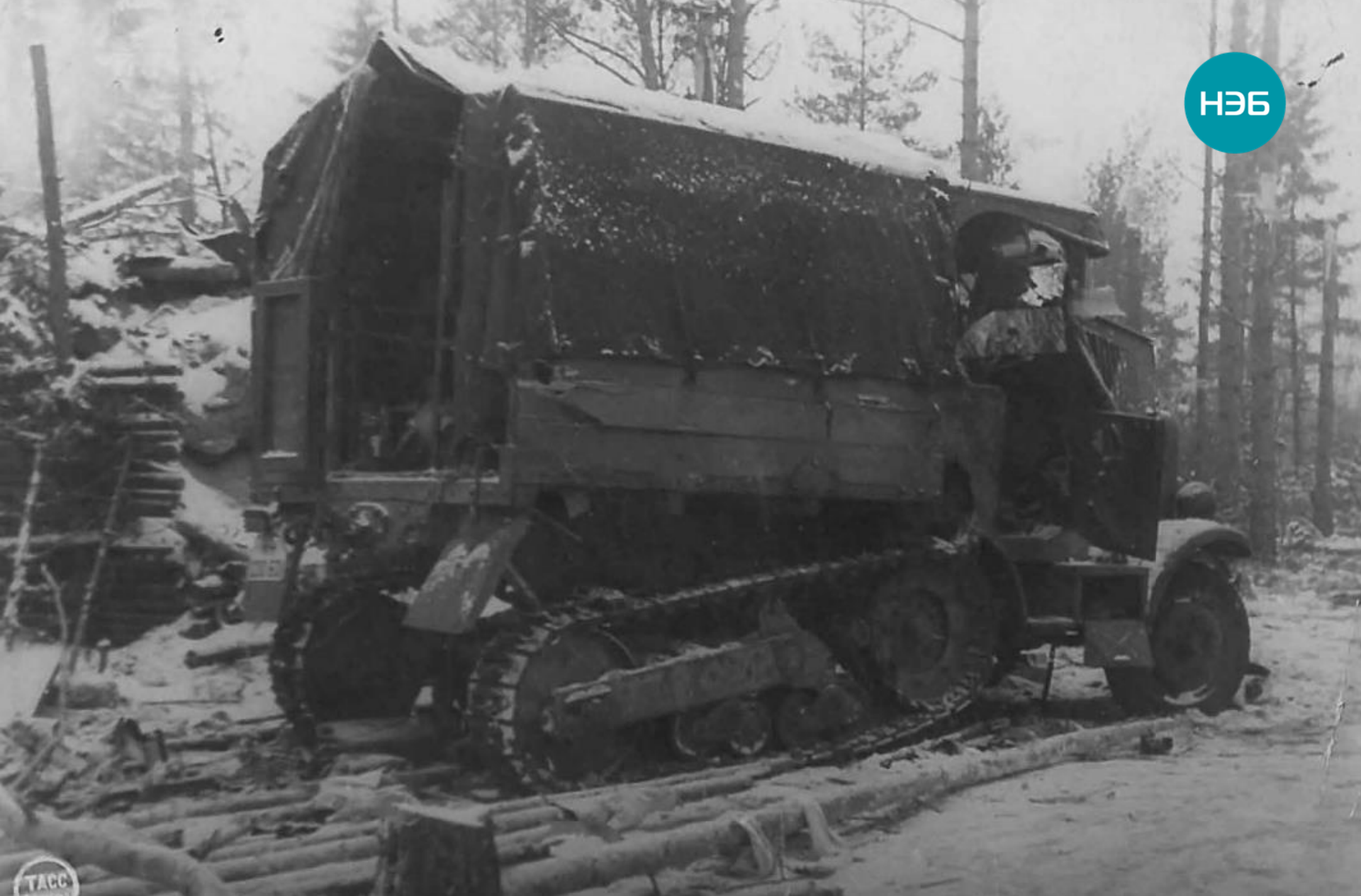
Трофеи, взятые нашими войсками в дни боев за прорыв блокады Ленинграда. Январь 1943.