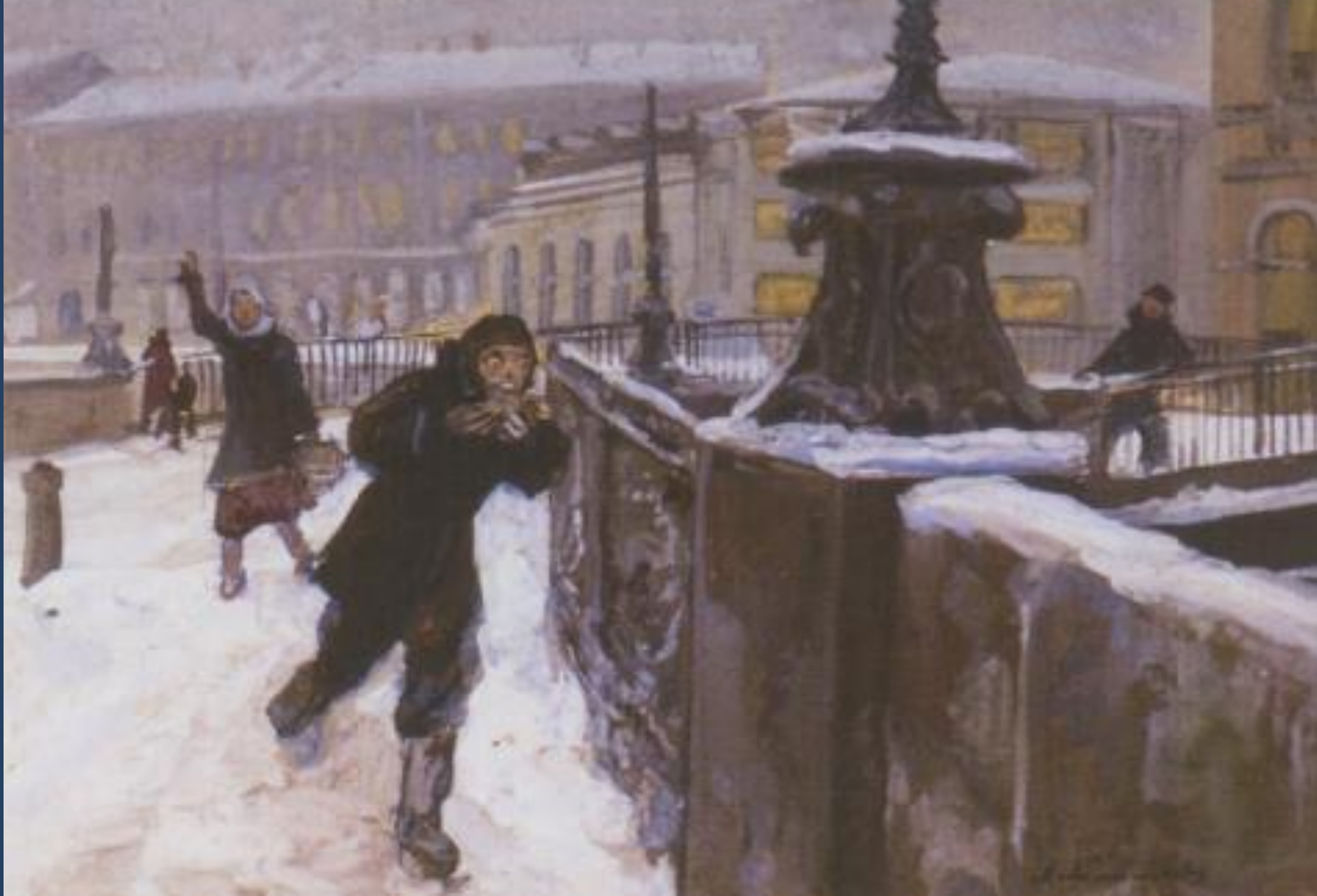
М. Г. Платунов «Ленинград в блокаде. Хлеб украл» Открытка, 1942.