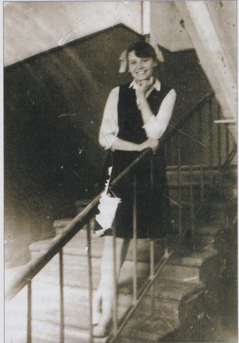
Школьные годы чудесные