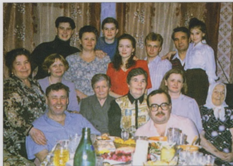
В большом семейном кругу