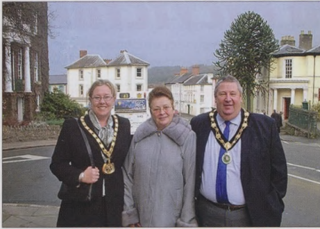
Профессиональная поездка в Англию