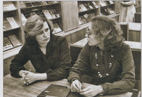
Погружение в профессию