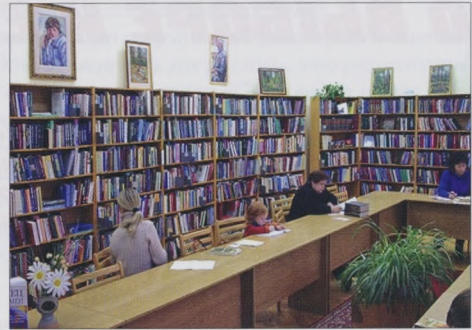
В мире книг

в школах состоялись сразу два выпуска: 10-х и 11-х классов, списки абитуриентов оказались переполнены.